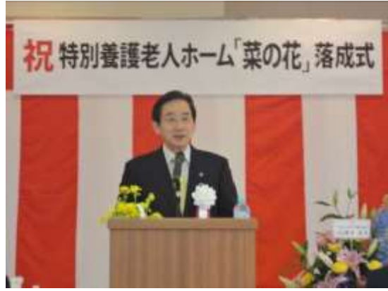
北村市長から祝辞を頂きました。