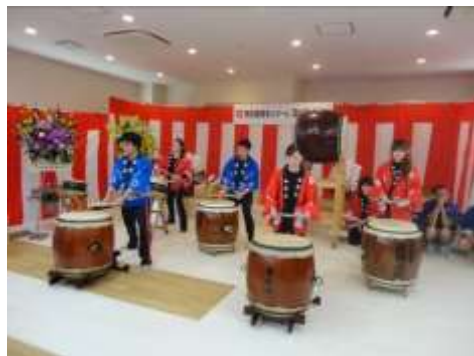
日頃の練習の成果を披露しました。