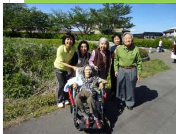
春真っ盛り 新緑の中ドライブに出かけました。天気にも恵まれ、車中は歌声に身も心も若返りました。