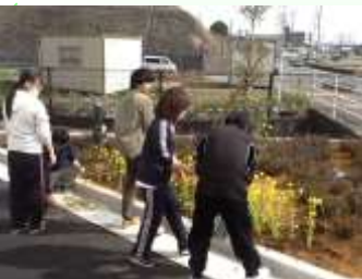
花壇に菜の花を植えました