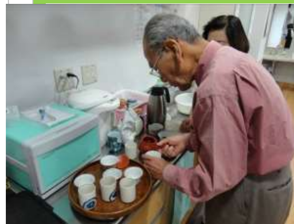
「新茶の会」で丹精込めてお茶を入れてくださいました。