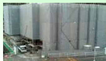
外壁工事・内装工事