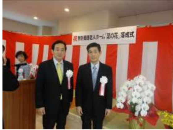
北村市長と星野理事長で記念撮影。