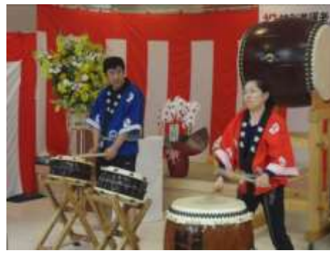
さくら・かりん 職員による和太鼓演奏。

4月1日のオープンを待ち望んで居られた70名の皆様は、入所検討会を経て、無事入居されました。在宅では大変お困りの方も今では他の方のお世話をされたりと、お陰様で大きな事故もなくゆったりとした時間を過ごされて居ります。開設後まだ日が浅くスタッフも1か月の研修を経たとしても、まだまだ未熟で入居者の皆様にはご迷惑をおかけしております。富士山を背に烏帽子山に抱かれて瀬戸に守られた環境の基で入居者の皆様と、その日その時を大切に、笑顔のたえない施設にしたいと考えております。「黄色の優しさ」と「芽生えの若葉色」の菜の花に相應しい、その人に合ったエネルギーなケアを目指し、努力して参る所存でございます。今後とも宜しくお願い申し上げます。