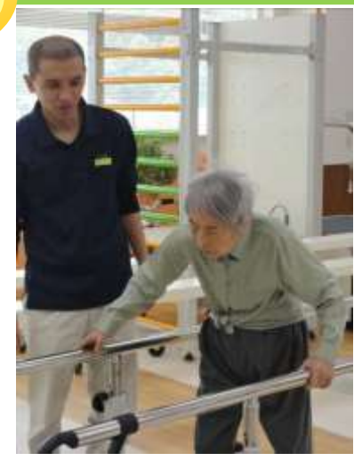
一歩一歩と、機能訓練もがんばっています。