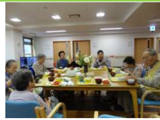
ご家族様と共に楽しく昼食中。お盆の色も菜の花色です。