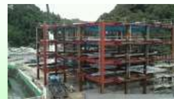
骨組完成しました