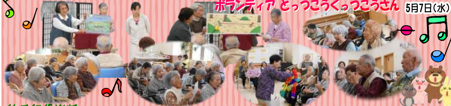
ボランティア とっくうくっくうさん 5月7日(水)