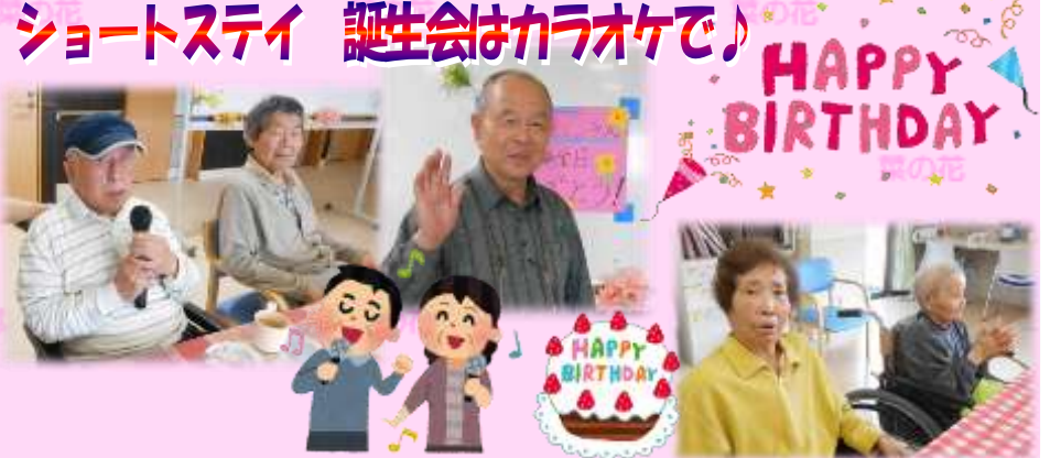
ショートステイ 誕生会はカラオケで!