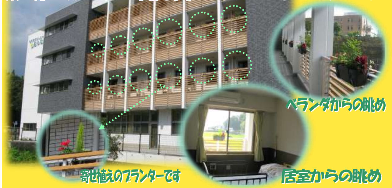
寄せ植えのプランターです