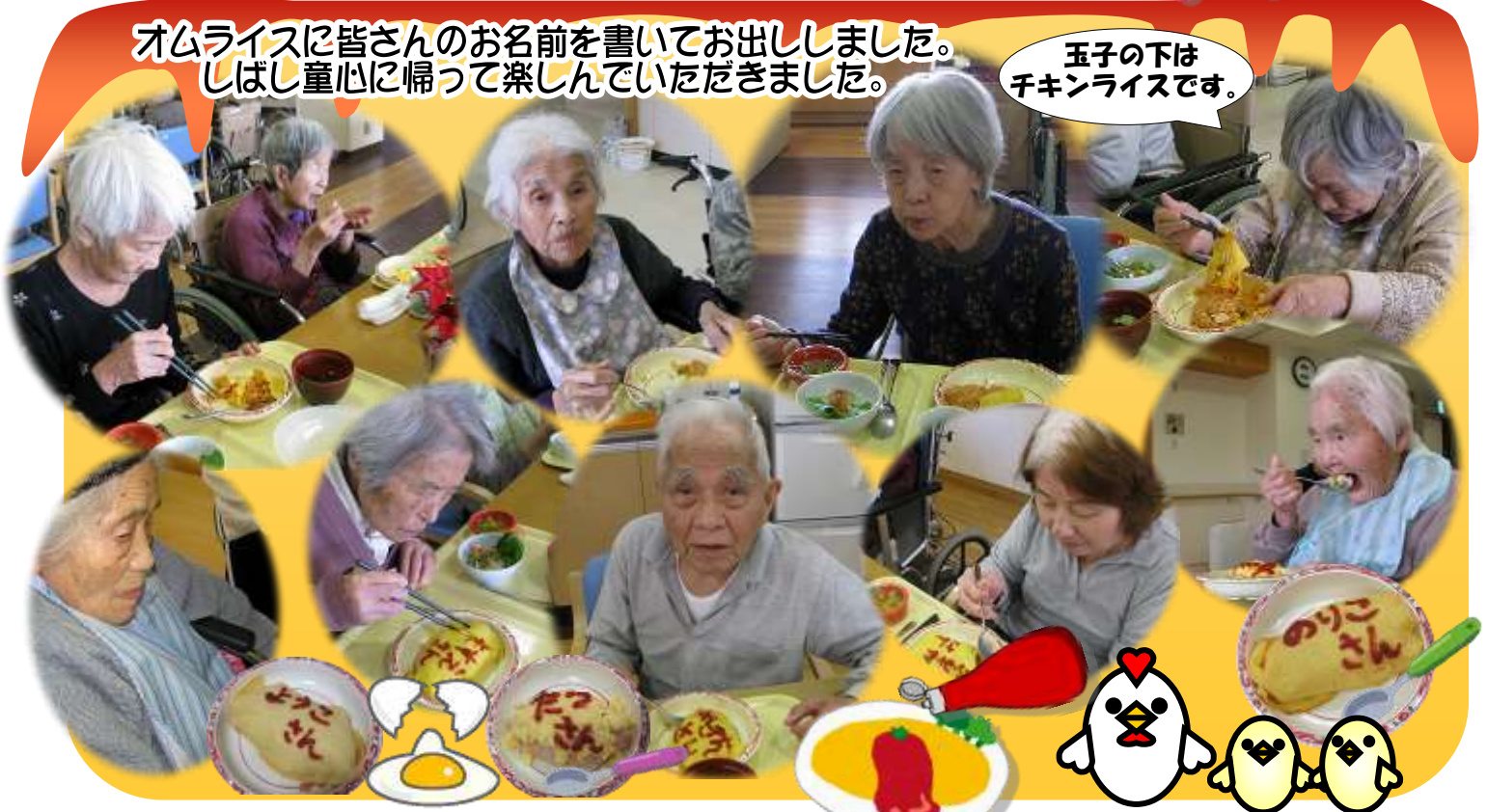
玉子の下はチキンライスです。