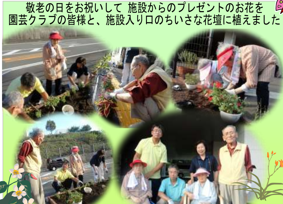
敬老の日をお祝いして 施設からのプレゼントのお花を園芸クラブの皆様と、施設入り口のちいさな花壇に植えました

● 感染症が流行しやすい時期になりました。 ● 熱・せき・鼻水・下痢など、感染症の恐れがある場合は 面会をい 遠慮ください。 ● エレベーター脇に洗面台がありますので、手洗い・手指の消毒をお願いいたします。 ● 65歳以上無料・施設の車で送迎します。 ● 結核予防健診（胸部X線撮影）を予定しております。 ● ご家族様に連絡の上、ほしのクリニックにて実施いたします。 ● 65歳以上無料・施設の車で送迎します。 ● インフルエンザ予防接種を予定しております。 ● 集団生活の場ですので、特別問題のない方以外は、入居者の皆様全員が対象となります。 別紙「お知らせ」を参考に協力お願いします。