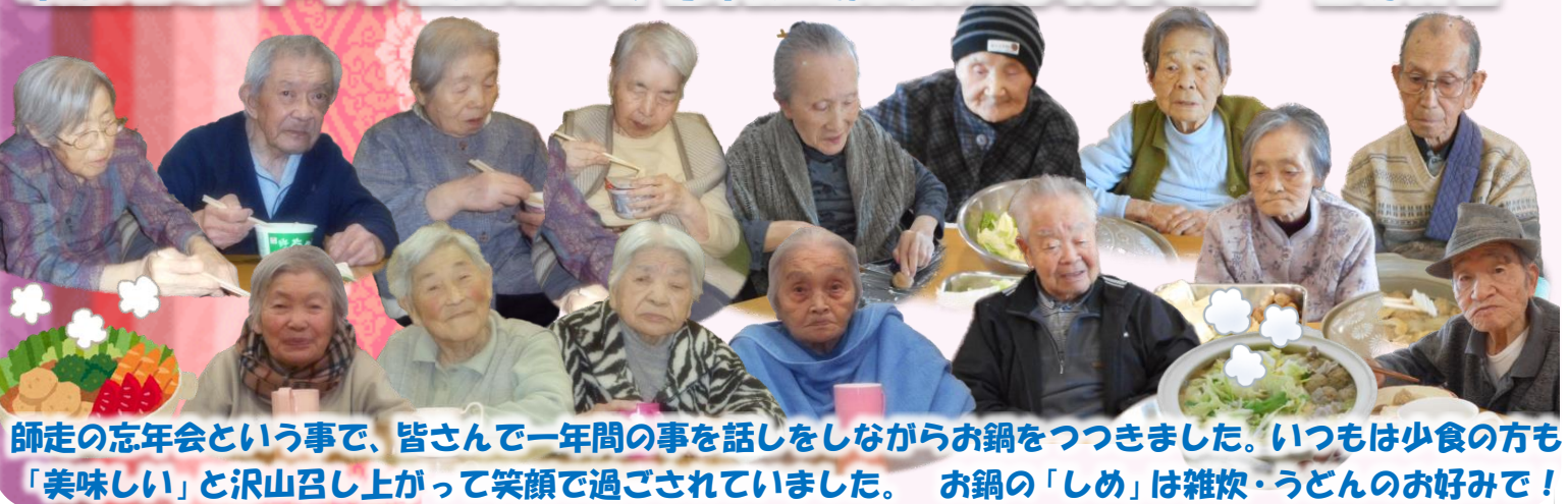
師走の忘年会という事で、皆さんで一年間の事を話しをしながらお鍋をつきました。いつもは少食の方も「美味しい」と沢山召し上がって笑顔で過ごされていました。お鍋の「しめ」は雑炊・うどんのお好みで!