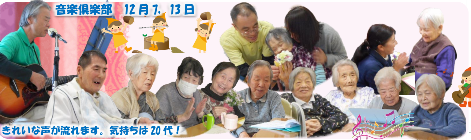
きれいな声流れます。気持ちは20代!