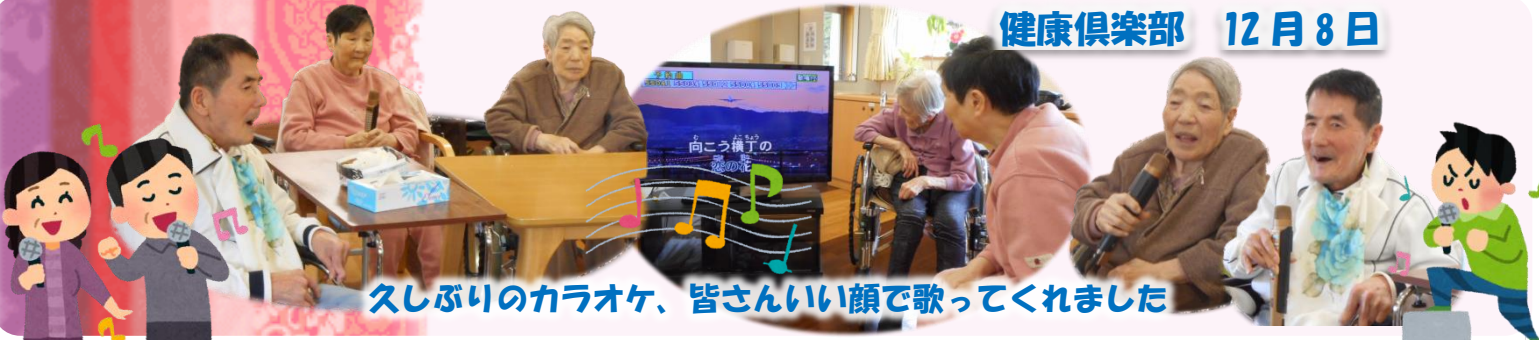
久しぶりのカラオケ、皆さんいい顔で歌ってくれました