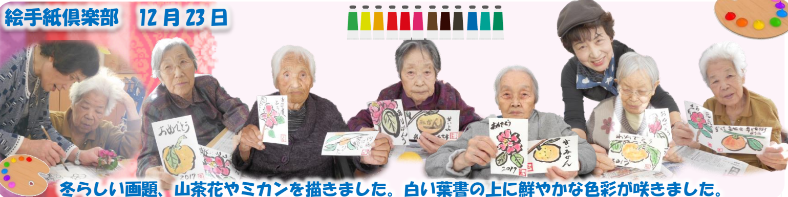
冬の画題、山茶花やミカンを描きました。白い葉書の上に鮮やかな色彩が映えました。