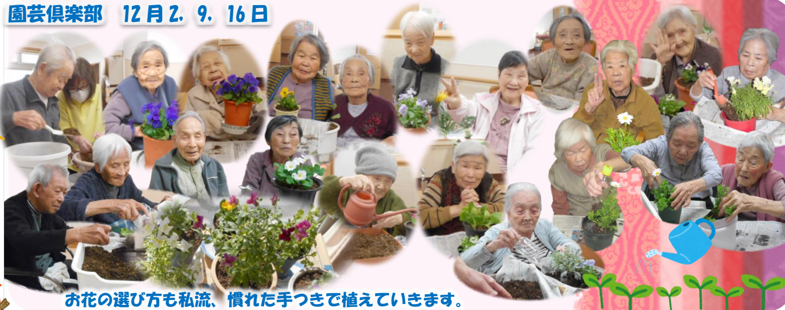
お花の選び方も私流、慣れた手つきで植えていきます。