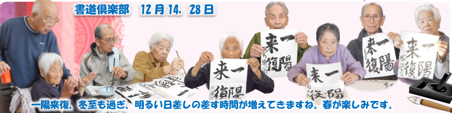
一陽来復、冬至も過ぎ、明るい日差しの差す時間が増えてきますね。春が楽しみです。