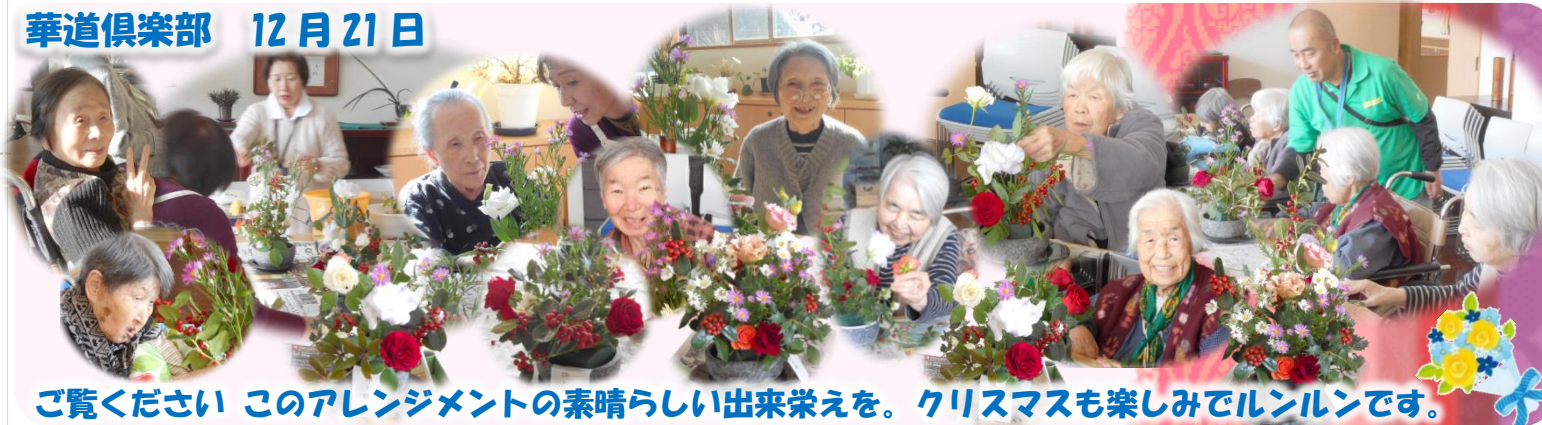
ご覧ください このアレンジメントの素晴らしい出来栄を。クリスマスも楽しみでイルンです。