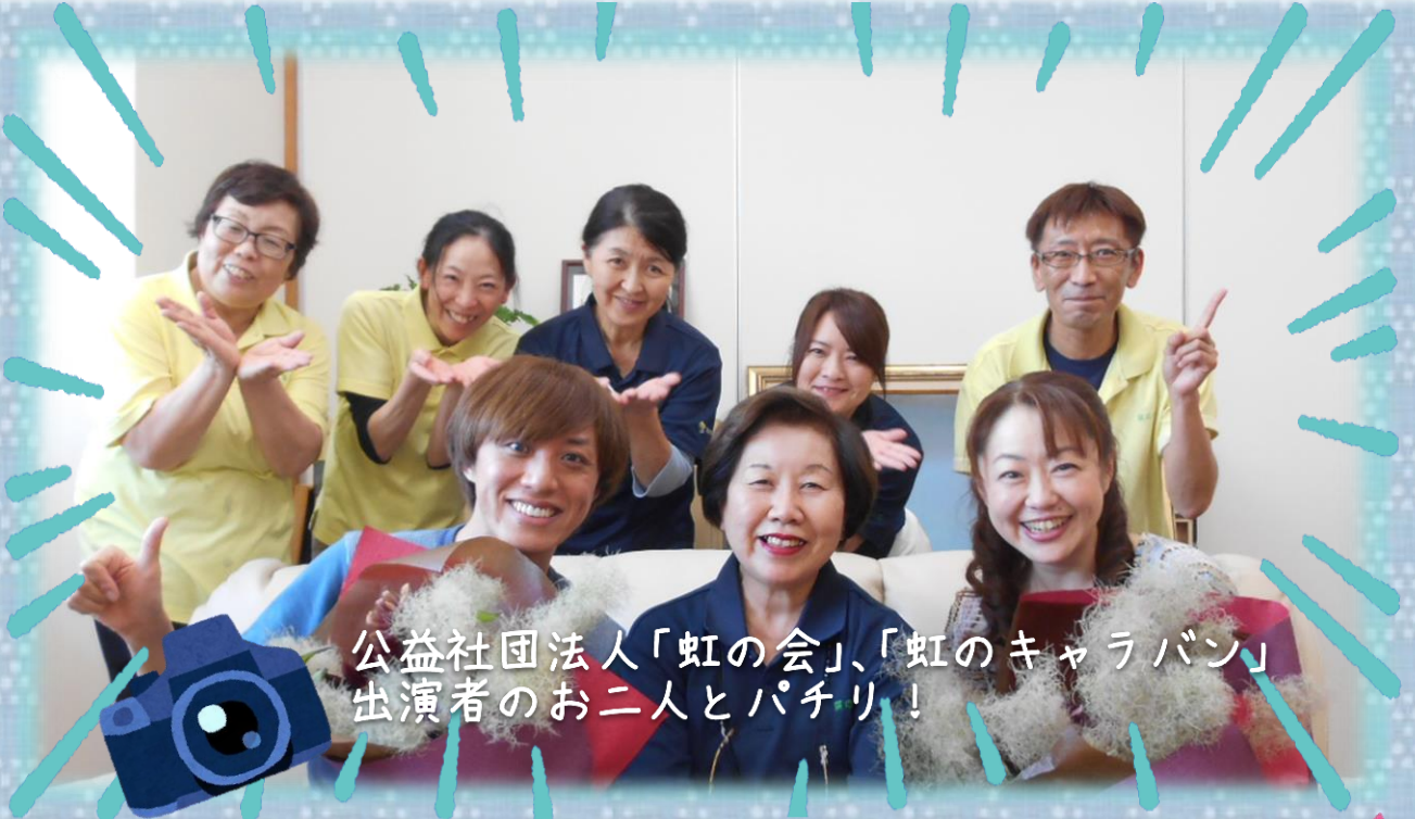
公益社団法人「虹の会」、「虹のキャラバン」出演者のお二人とパチリ！