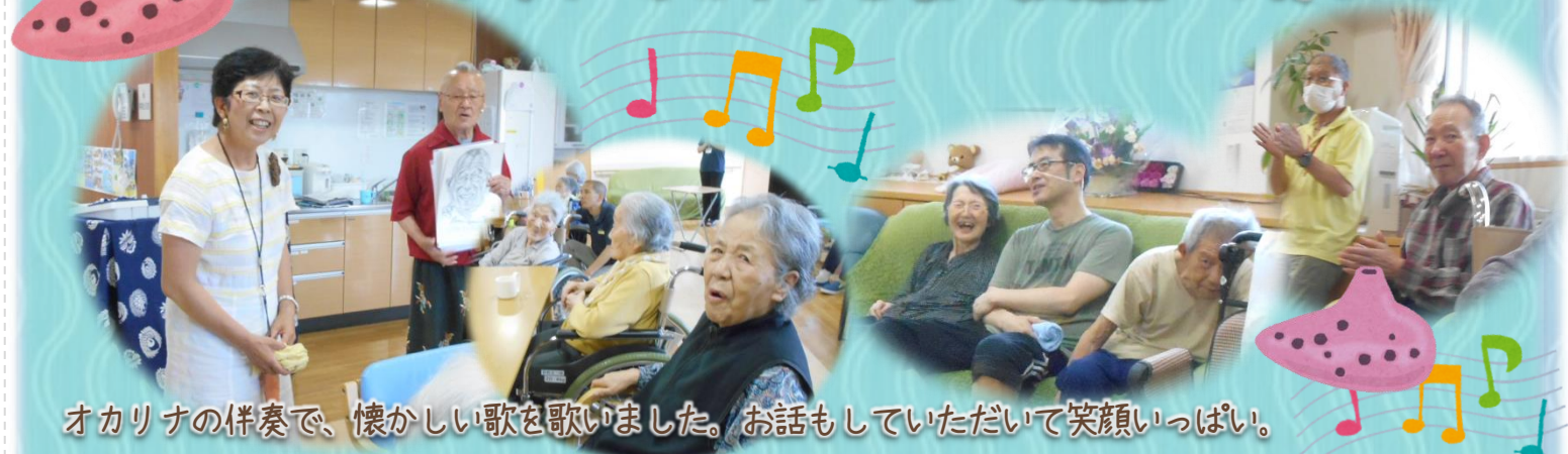
オカリナの伴奏で、懐かしい歌を歌いました。お話もしていただいて笑顔いっぱい。