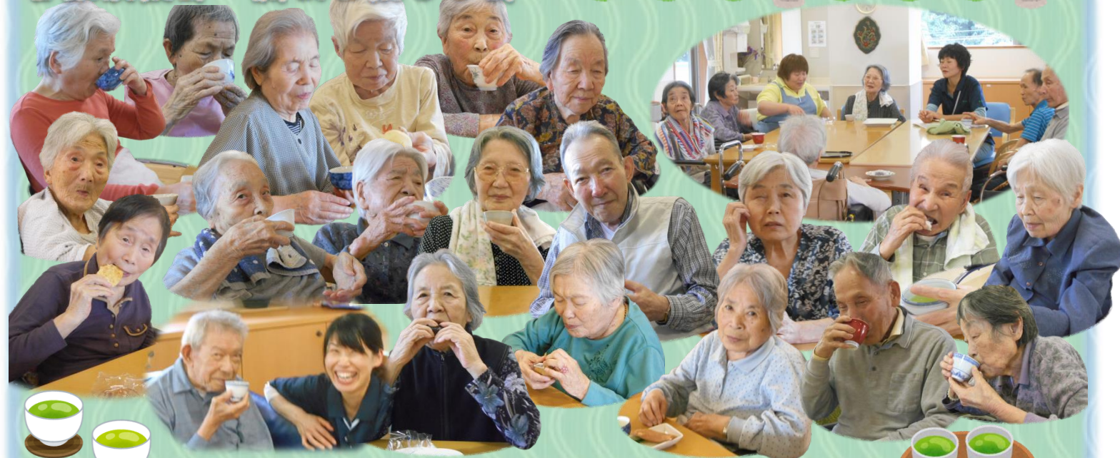
爽やかな香りとすっきりと甘い新茶の味を堪能しました。 「やっぱり新茶はみるくて美味しいねえ」と、心も体も癒やされました。