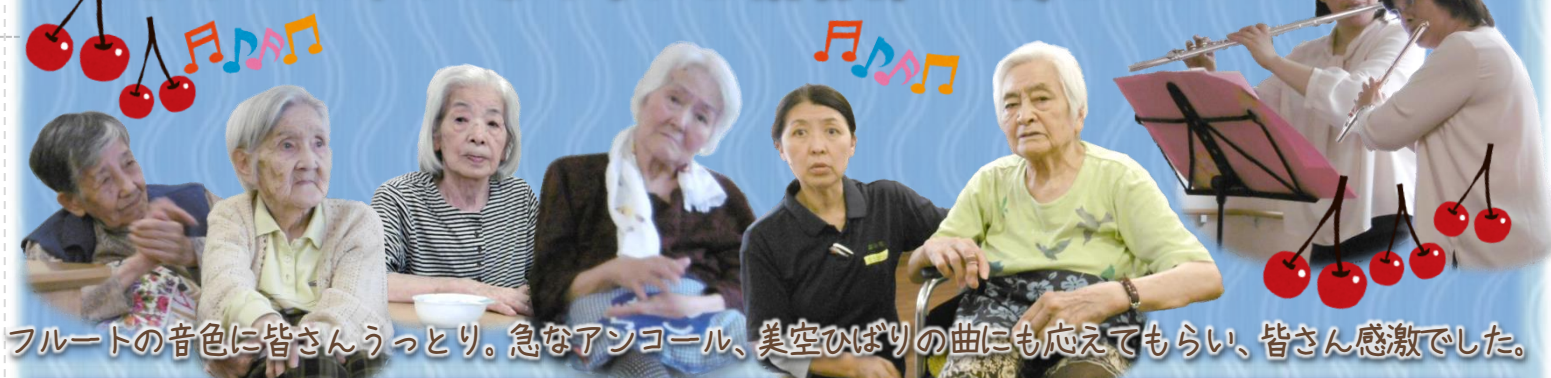
フルートの音色に皆さんうっとり。急なアンコール、美空ひばりの曲にも応えてもらい、皆さん感激でした。