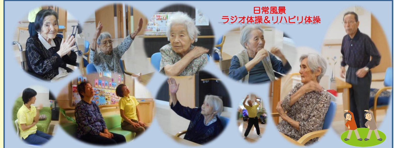
日常風景 ラジオ体操&リハビリ体操

健康診断のお知らせ 十月頃から、入居者の皆様の健康診断を実施する予定です。 インフルエンザ予防接種 インフルエンザ予防接種を予定しています。集団生活の場ですので、接種に特別問題のない入居者様は全員が接種対象となります。後日問診票を送付しますので、記入の上お早目にご返送下さい。 感染症にご注意ください 感染症が流行しやすい時期が近づいています。せき・鼻水・下痢など、感染症のおそれがある場合は、面会をご遠慮ください。 菜の花まつり御礼 九月十七日に開催しました菜の花まつりは、悪天候が予想されたため、外部のお客様にはご遠慮いただき、ご利用のお客様とご家族様で催しやバザーをお楽しみいただきました。来場いただきました皆様、ありがとうございました。また、ご協賛をいただきましたことをご報告の上、御礼申し上げます。 ・ウエルシア薬局藤枝駿河台店様 ・株式会社トキワTC様 ・株式会社りす医療器様