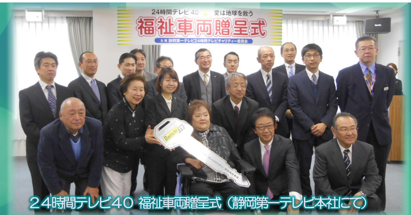
24時間テレビ40 福祉車両贈呈式 (静岡第一テレビ本社にて)