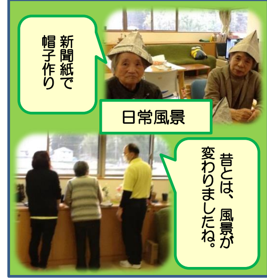
新聞紙で帽子作り