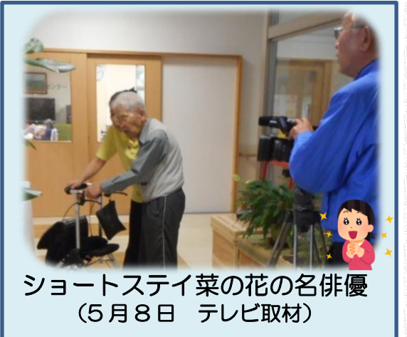
ショートステイ菜の花の名俳優 (5月8日 テレビ取材)