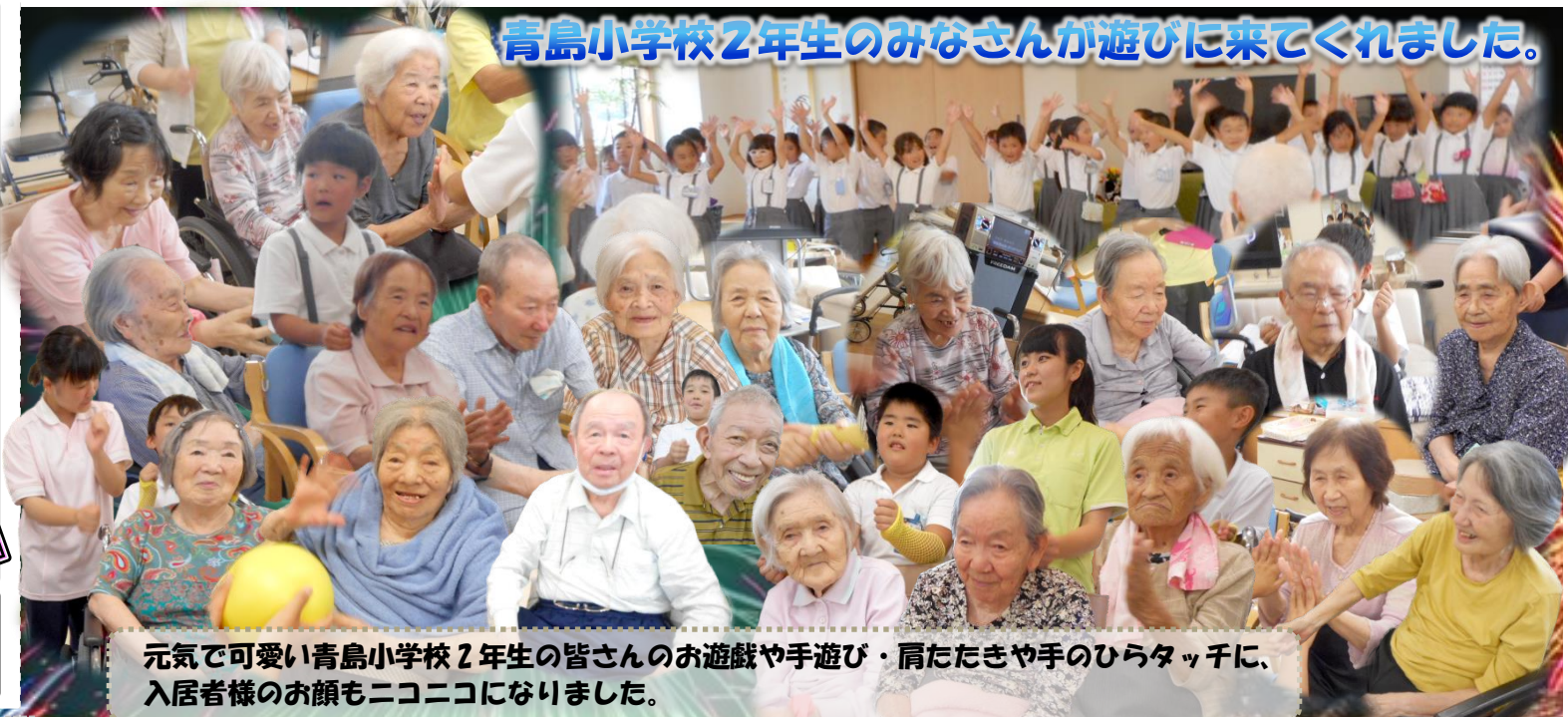
青島小学校2年生のみなさんが遊びに来てくれました。

元気で可愛い青島小学校2年生の皆さんのお遊戯や手遊び・肩たたきや手のひらタッチに、入居者様のお顔もニコニコになりました。