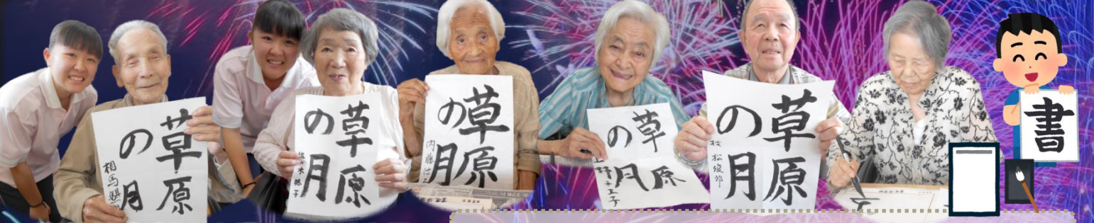
書道倶楽部 7月11日 15日