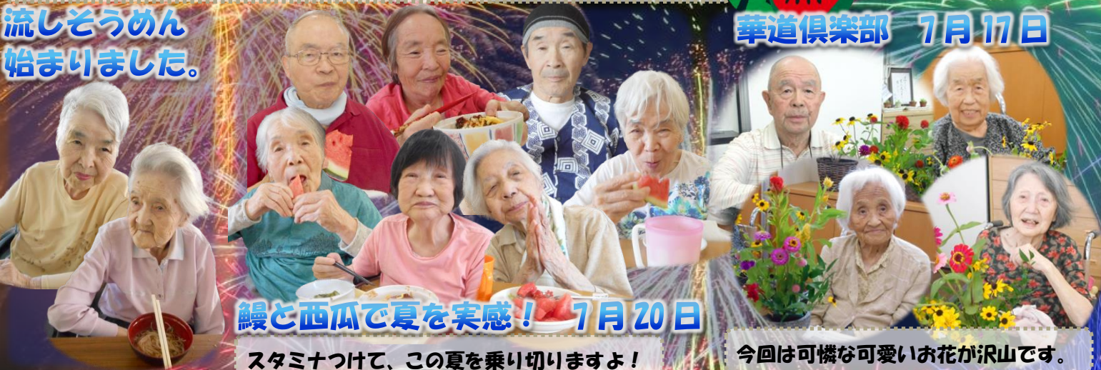
流しそうめん 始まりました。