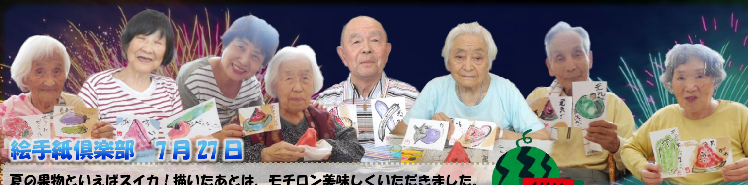
絵手紙倶楽部 7月27日