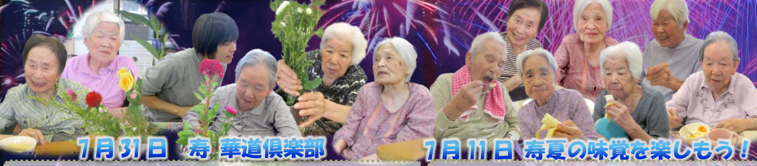
7月31日 寿華道倶楽部