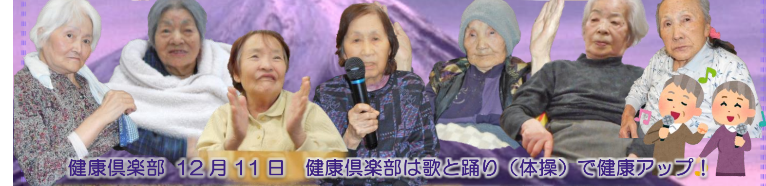
健康倶楽部 12月11日 健康倶楽部は歌と踊り(体操)で健康アップ!