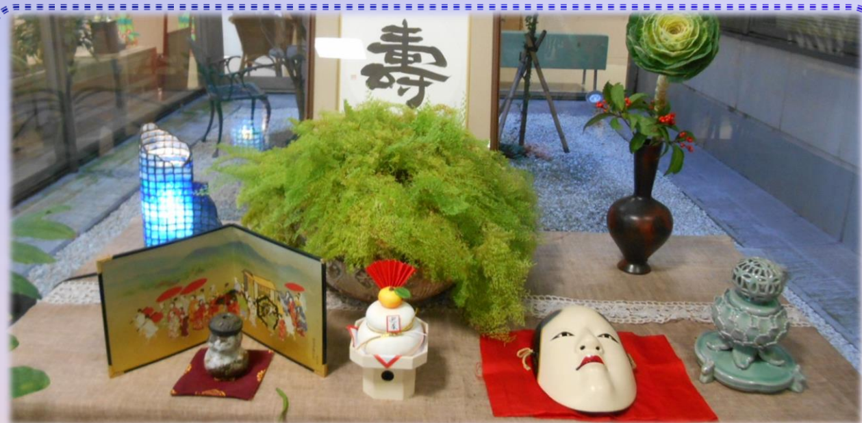
新年あけましておめでとうございます。本年もどうぞよろしくお願いたします。