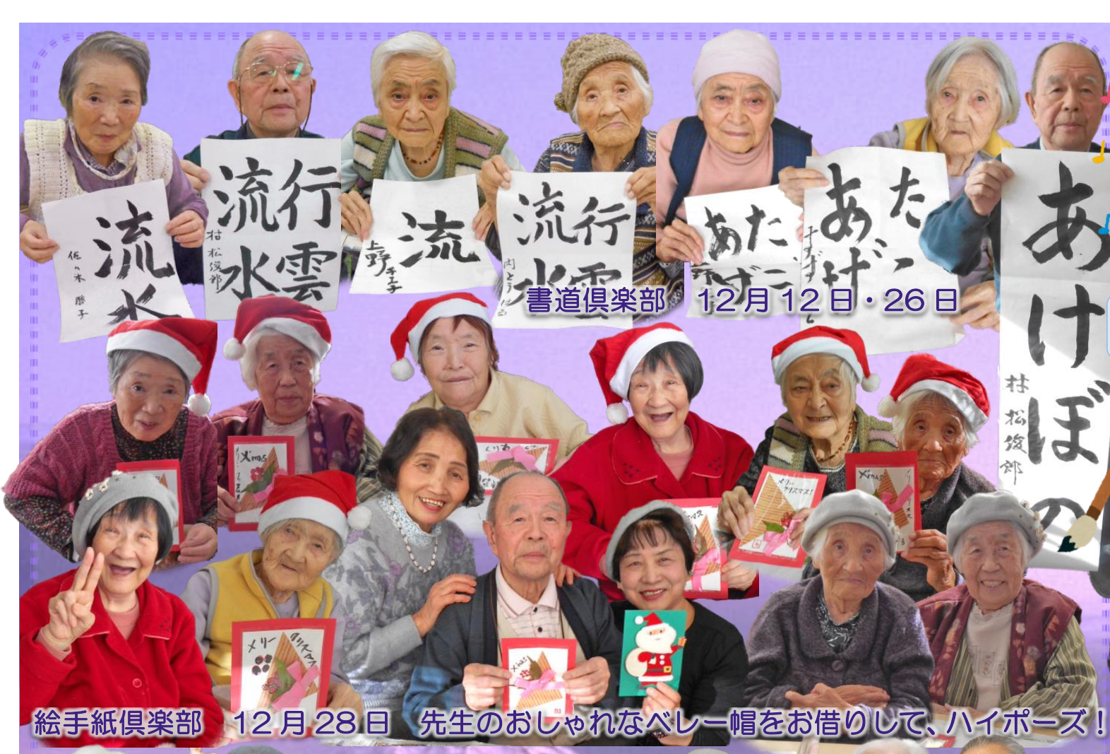
流行水雲 書道倶楽部 12月12日・26日