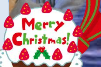
12月24日、クリスマス会を行いました。皆で歌を歌って、美味しいケーキをいただきました。サンタさんがプレゼントを配ったので「喜びっくり!」でした。