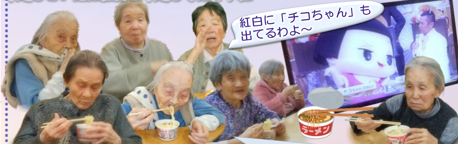
紅白歌合戦、お孫さんぐらいの若手歌手を手拍子や踊りで応援して楽しみました。見ているうちに小腹が空いたのでお夜食にミニラーメンを食べました。