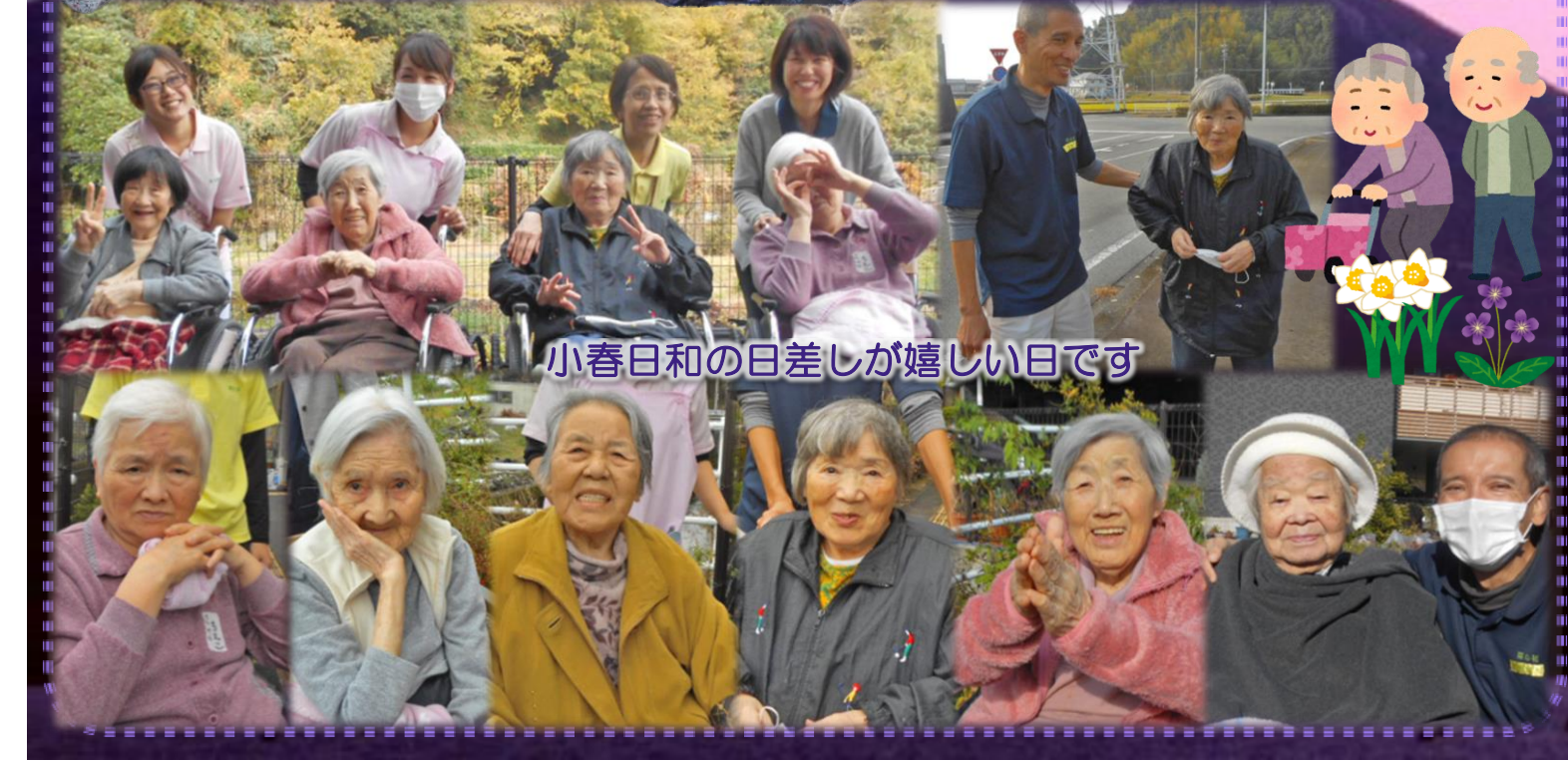
小春日和の日差しが嬉しい日です