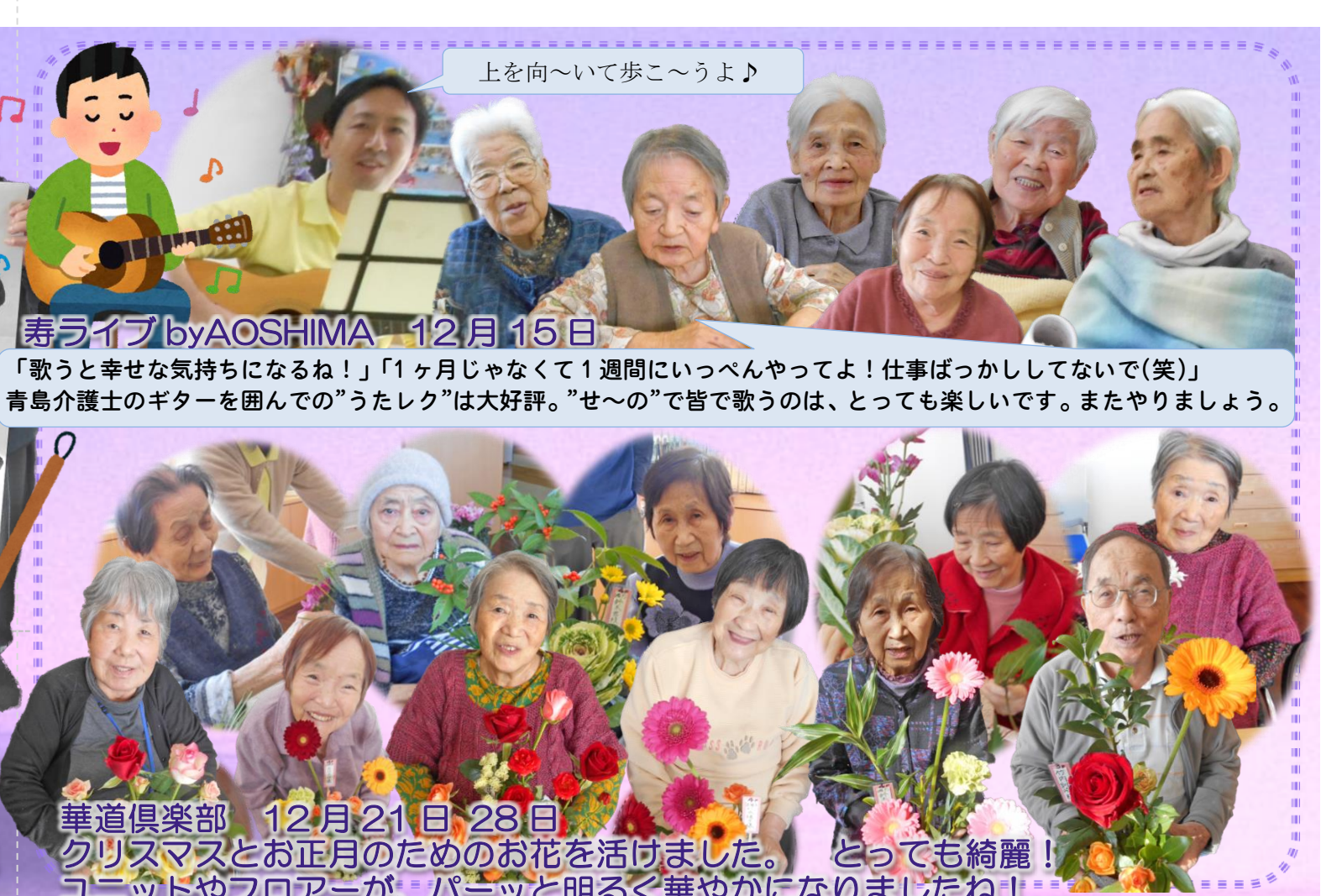
上を向〜いて歩こ〜うよ♪ 寿ライブ by AOSHIMA 12月15日 「歌うと幸せな気持ちになるね!」「1ヶ月じゃなくて1週間にいっぱいやってよ!仕事ばっかしてないで(笑)」 青島介護士のギターを囲んでの”うたレク”は大好評。”せ〜の”で皆で歌うのは、とっても楽しいです。またやりましょう。