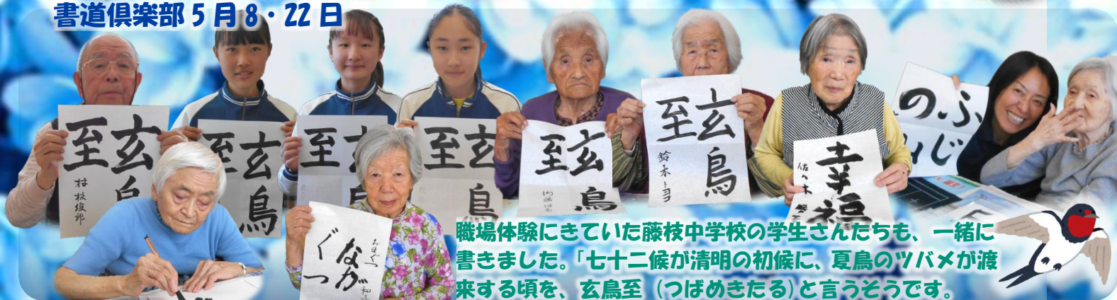
職場体験にきていた藤枝中学校の学生さんたちも、一緒に書きました。「七十二候が清明の初候に、夏鳥のツバメが渡来する頃を、玄鳥至（つばめきたる）と言うそうです。