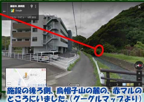
施設の後ろ側、烏帽子山の麓の、赤マリのところにいました。(グーグルマップより)

5月26日、職員が「裏の烏帽子山に何かいる！」と写メを撮ってくれました。ニホンカモシカ...でしょうか？背中を見せて振り返っています。