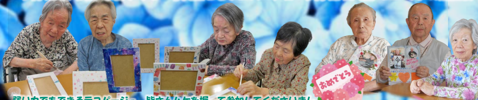
弱い力でもできるデコページ。皆さんハケを握って参加してくださいました。「やあ簡単でいいね」「上手にできた。可愛いよ」「こんな（デコページ）があるだね」と、新鮮に感じて楽しんでいただけただけで良かったです。お互いに作品を誉め合う皆さんも微笑ましかったです。