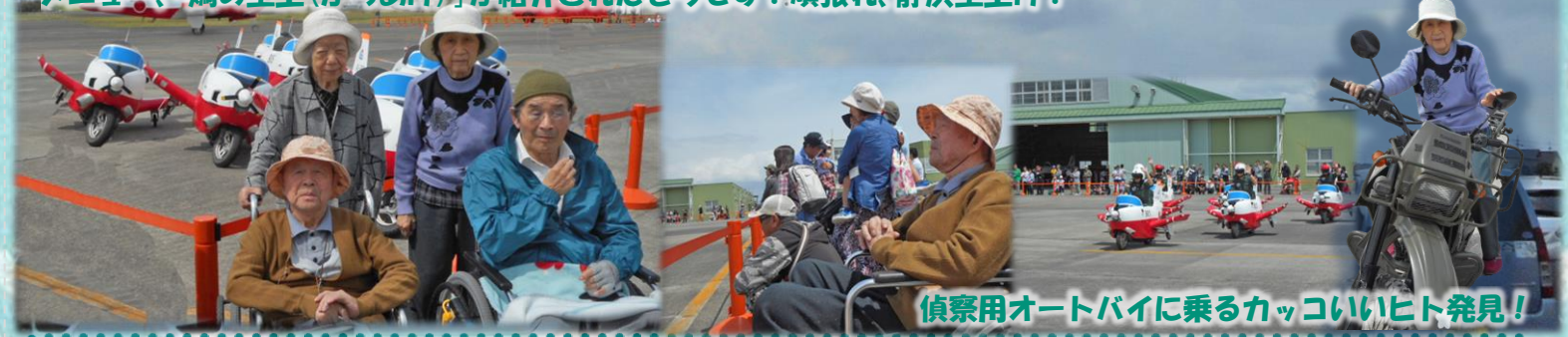
偵察用オートバイに乗るカッコいいヒト発見！