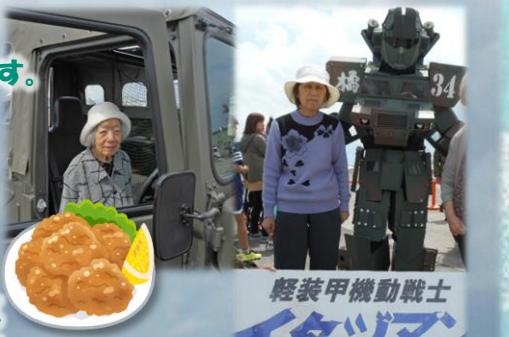
軽装甲機動戦士 イタツマン

航空自衛隊小話：海上自衛隊はカレーが名物として一般にもよく知られています。航空自衛隊の名物は、唐揚げだそうです。「より上を目指す」という意味を込めて「空上げ（唐揚げ）」と呼んで各基地で特色ある「名物」空上げに取り組んでいるそうです。その中でも、静浜基地の「空上げ」が5月末に「航空教育集団調理大会」で最優秀賞を獲得し、来年2月の全国大会出場が決まったそうです。全国 NHK 総合で毎週火曜日に放送されている「サラメシ」で、静浜基地の人気メニュー、「鶏の空上（からあげ）」が紹介されたそうです！頑張れ、静浜空上げ！