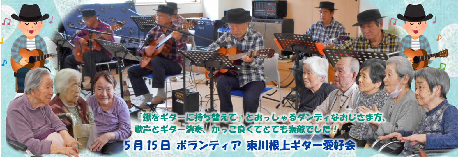
「鎌をギターに持ち替えて」とおっしゃるダンディなおじさま方、歌声とギター演奏、かっこよくてとても素敵でした！