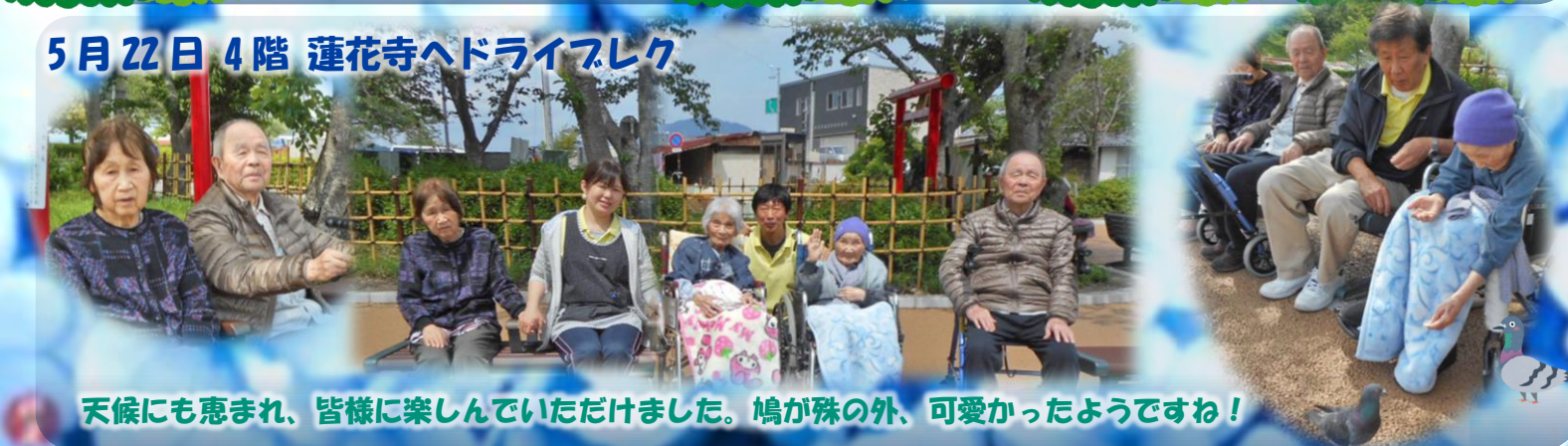
天候にも恵まれ、皆様楽しんでいただけました。鳩が殊の外、可愛かったようですわ！