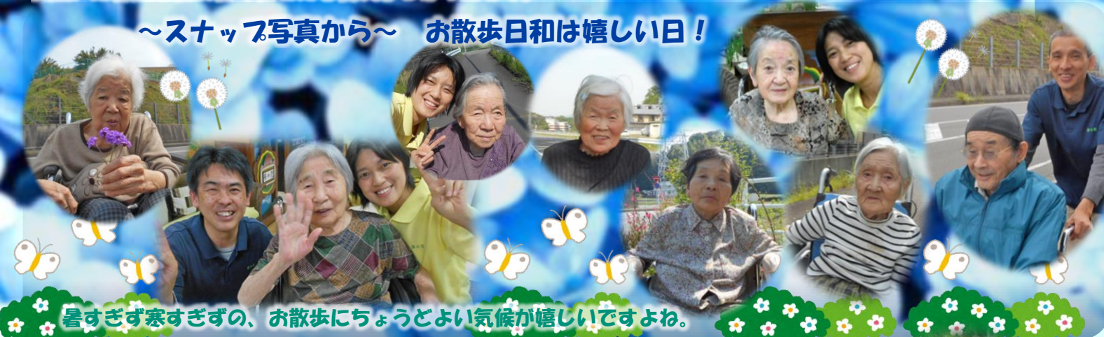
暑すぎず寒すぎずの、お散歩にちょうどよい気候が嬉しいですよね。