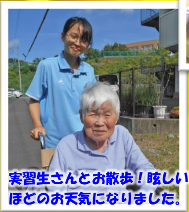
実習生さんとお散歩! 眩しいほどのお天気になりました。