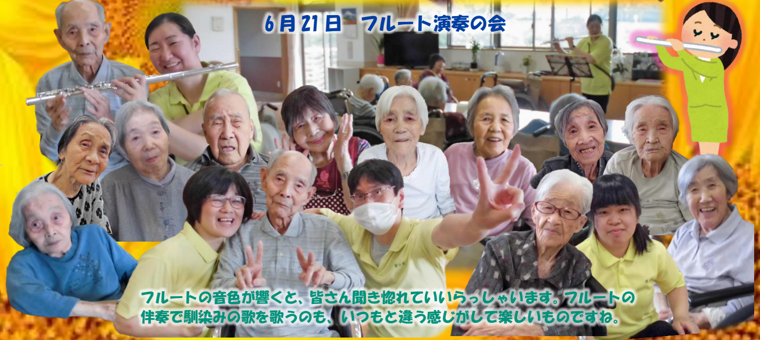
フルートの音色が響くと、皆さん聞き惚れていらっしゃいます。フルートの 伴奏で馴染みの歌を歌うのも、いつもと違う感じがして楽しいものですね。

私自身福祉施設での業務が初めてで緊張していましたが、皆さまのおかげで楽しく業務を行っています。 厨房スタッフ九名で運営しておりますが、日々忙しい中でも菜の花様に入所されている方々や職員の皆様 に毎日おいしいお食事を提供し食事が楽しみなって いただけるよう取り組んでまいります。 これからもよろしくお願いたします。