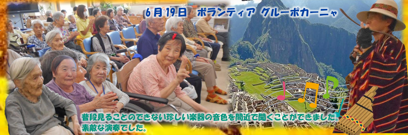
普段見ることのできない珍しい楽器の音色を間近で聞くことができました。 素敵な演奏でした。