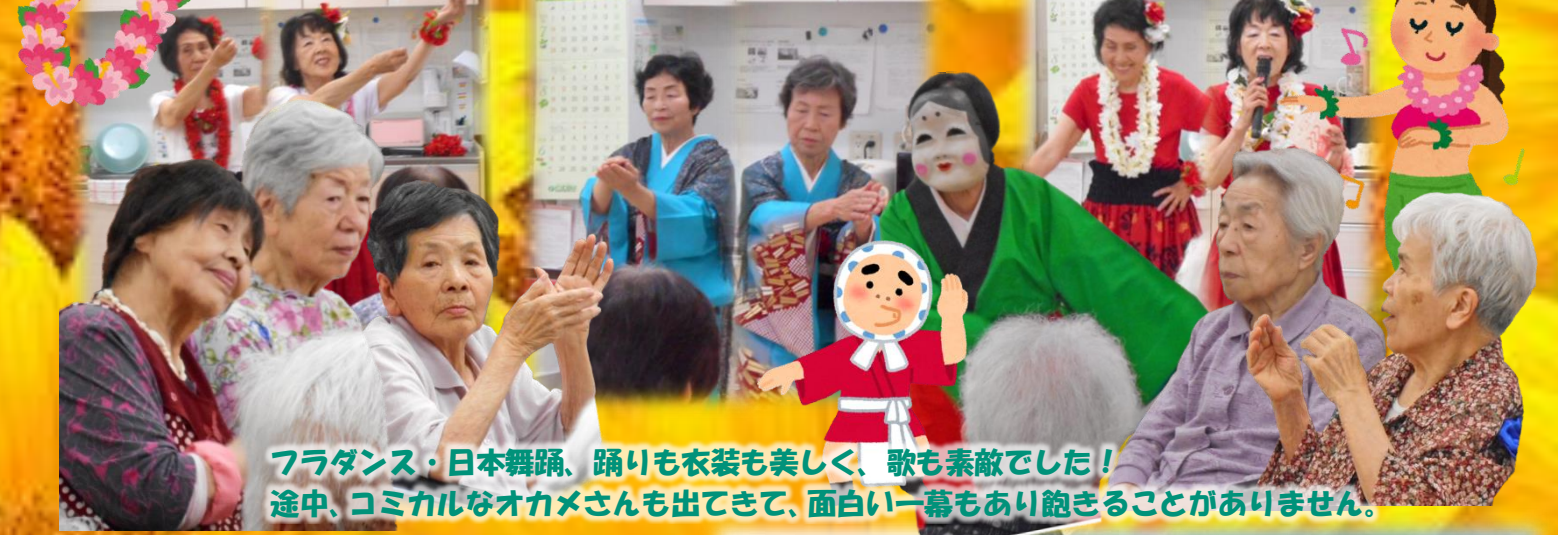
フラダンス・日本舞踊、踊りも衣装も美しく、歌も素敵でした！ 途中、コミカルなおカメさんも出てきて、面白い一幕もあり飽きることがありません。