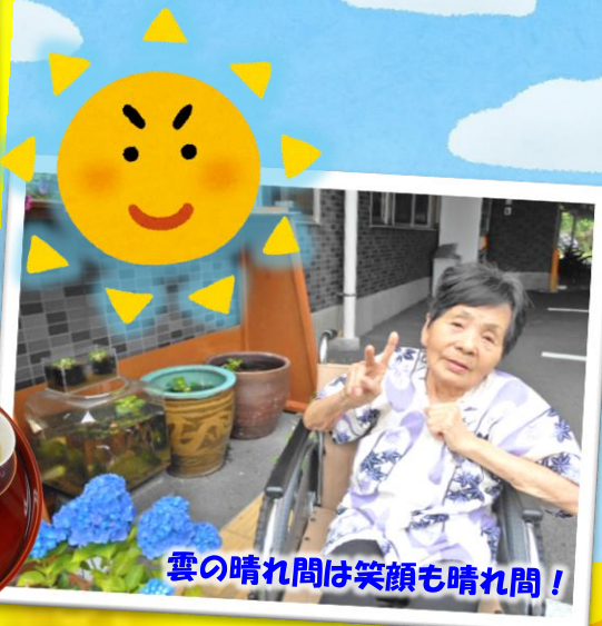
雲の晴れ間は笑顔も晴れ間!