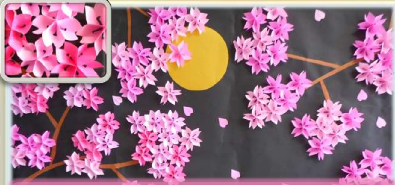
富士ユニット 季節の飾り「夜桜」花びら一枚一枚を切って作ってあります。