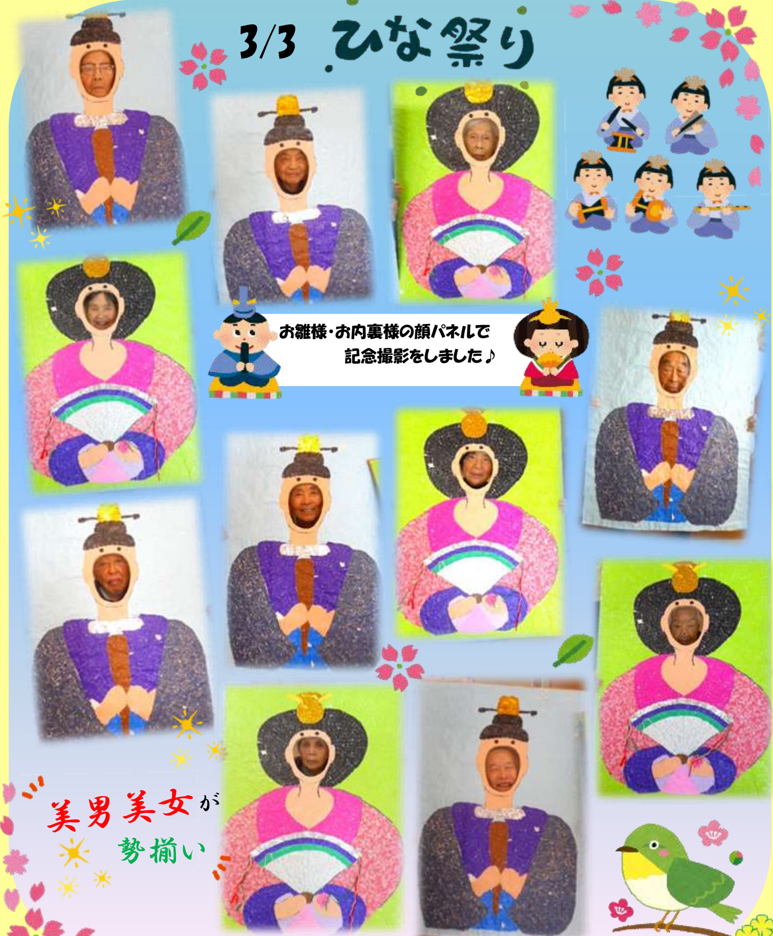
お雛様・お内裏様の顔パネルで 記念撮影をしました♪