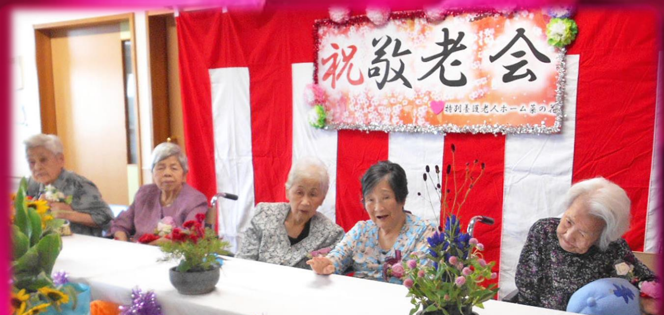
各階毎に敬老会を開催しました。アットホームな良い式になりました。

ご相談を随時受け付けております。 お気軽にお問い合わせ下さい。 ショートステイ菜の花 054-646-7087 編集 桑高