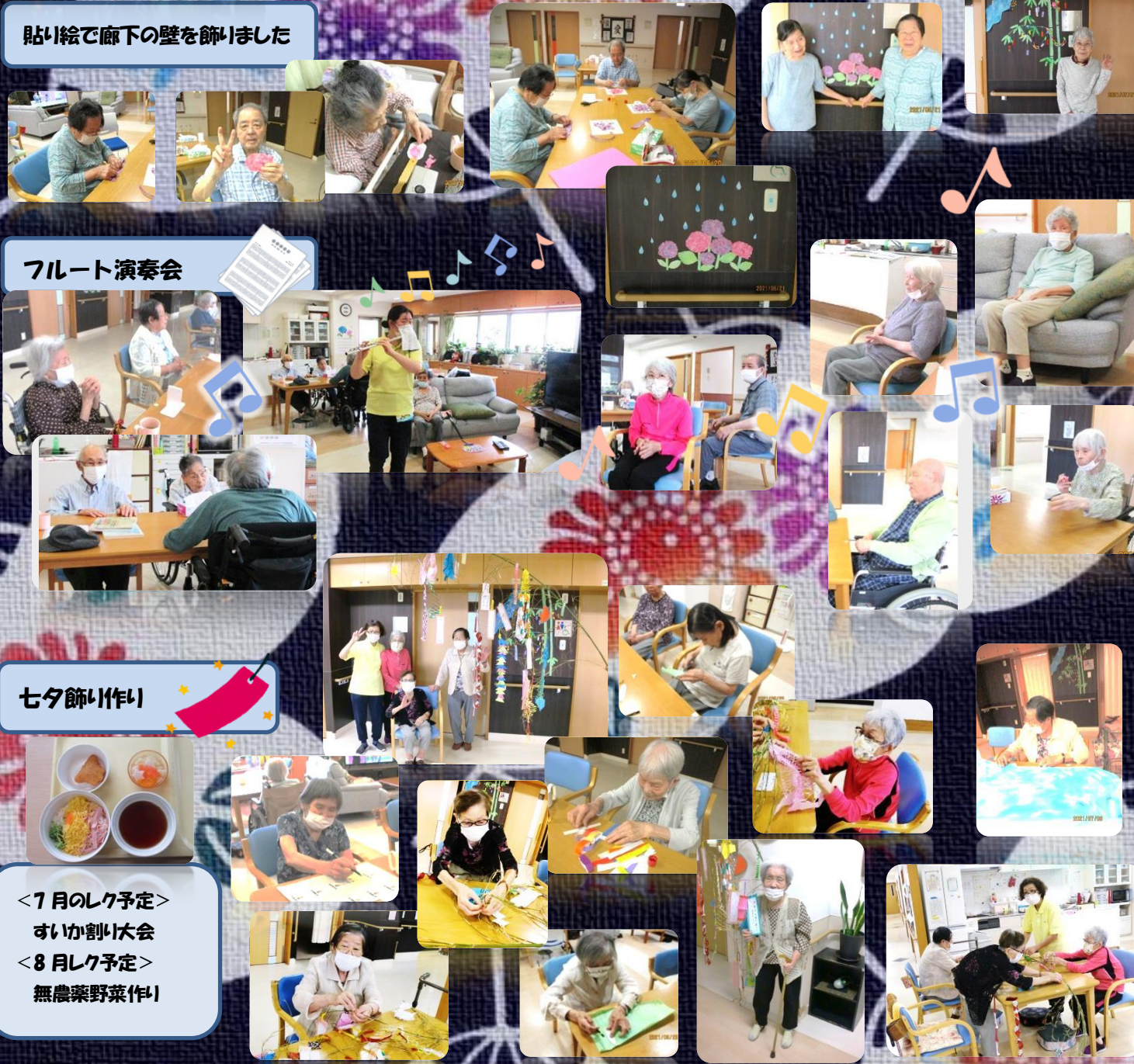
貼り絵で廊下の壁を飾りました