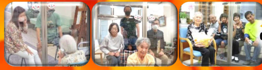
面会の予約について 火曜日・木曜日を除く10:20~11:00、14:20~15:40のうち、20分間隔で予約をお受けしています。*感染流行地域の方・風邪症状の方の面会はお遠慮ください。