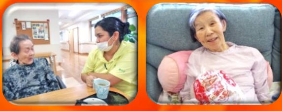
ご家族さまから手作りおこし(ボン菓子や水飴などで固めたお菓子)の差し入れがありました。嬉しそうなお顔に職員も嬉しい！