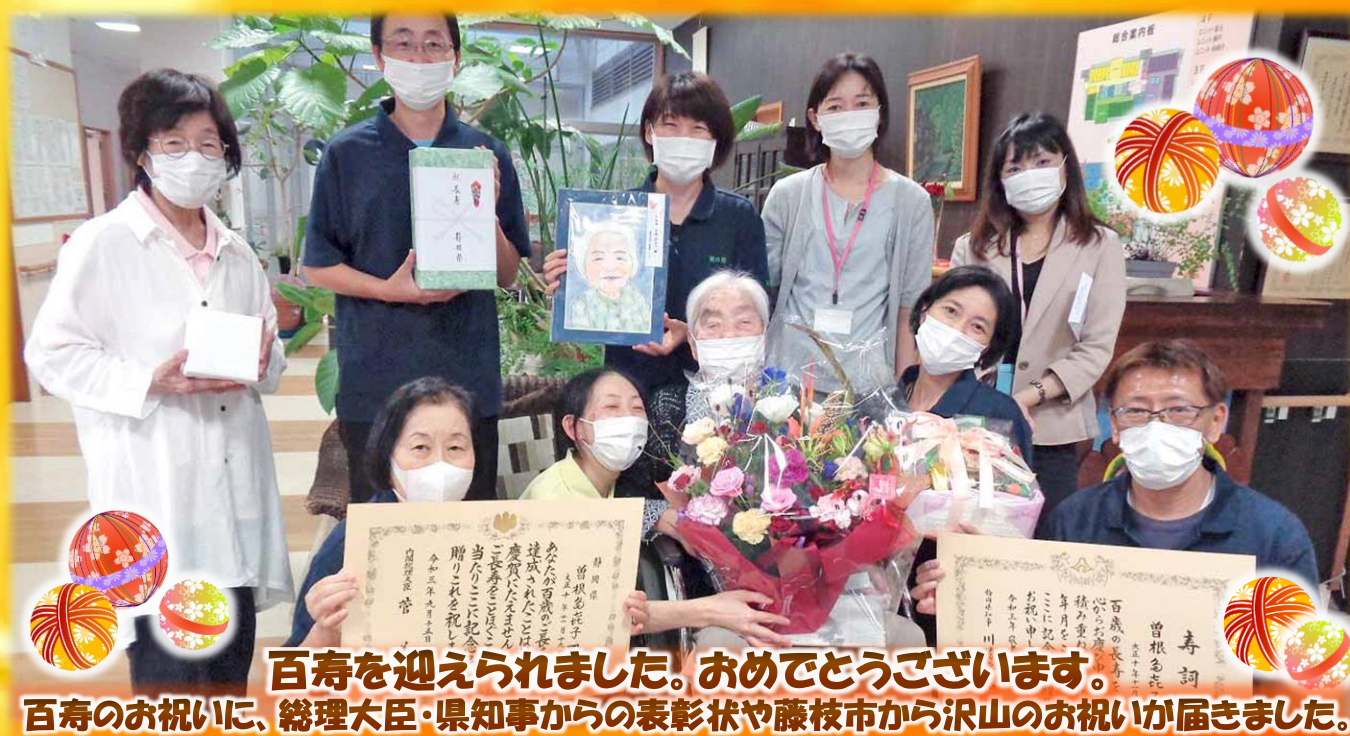
百寿を迎えられました。おめでとうございます。 百寿のお祝いに、総理大臣・県知事からの表彰状や藤枝市から沢山のお祝いが届きました。