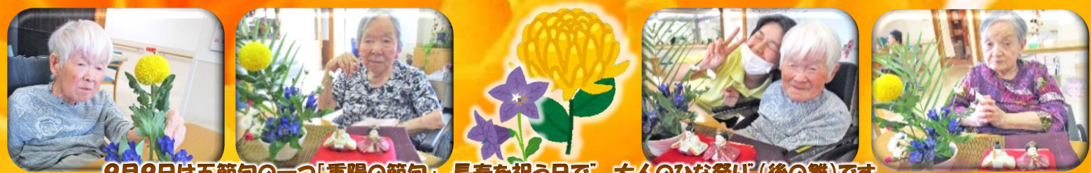
9月9日は五節句の一つ「重陽の節句」。長寿を祝う日で「大人のひな祭り(後の雛)」です。順番に花入れに花を一本ずつ活けていき、2周して菊の節句のアレンジメントが出来上がりました。「ボンボン菊がお月さんみたいで丸くてかわいいね」「本当だね」とにっこり。花器を回してみんなで一つのお花を完成させました。秋らしくて良いです。