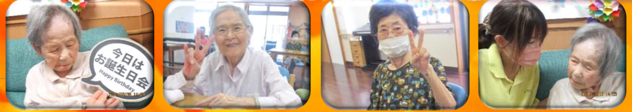
お誕生日、おめでとうございます。今回のお誕生会では、くじ引きや射的、カラオケ大会で楽しみました。