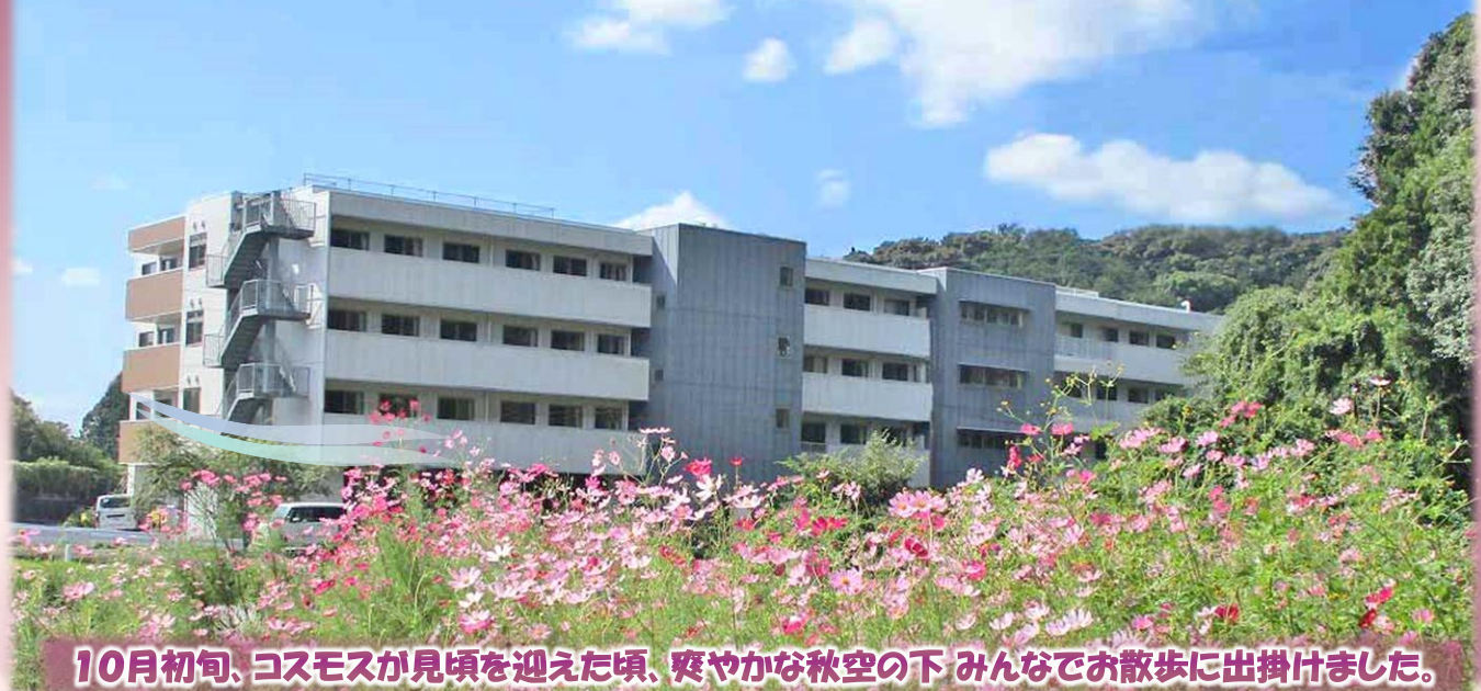
10月初旬、コスモスが見頃を迎えた頃、爽やかな秋空の下 みんなでお散歩に出掛けました。