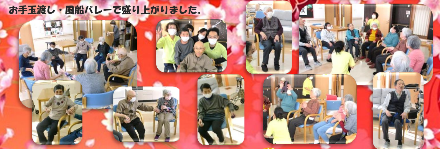
お手玉渡し・風船バレーで盛り上がりました。