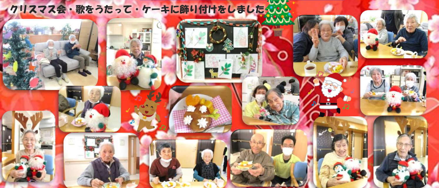
クリスマス会・歌をうたって・ケーキに飾り付けをしました