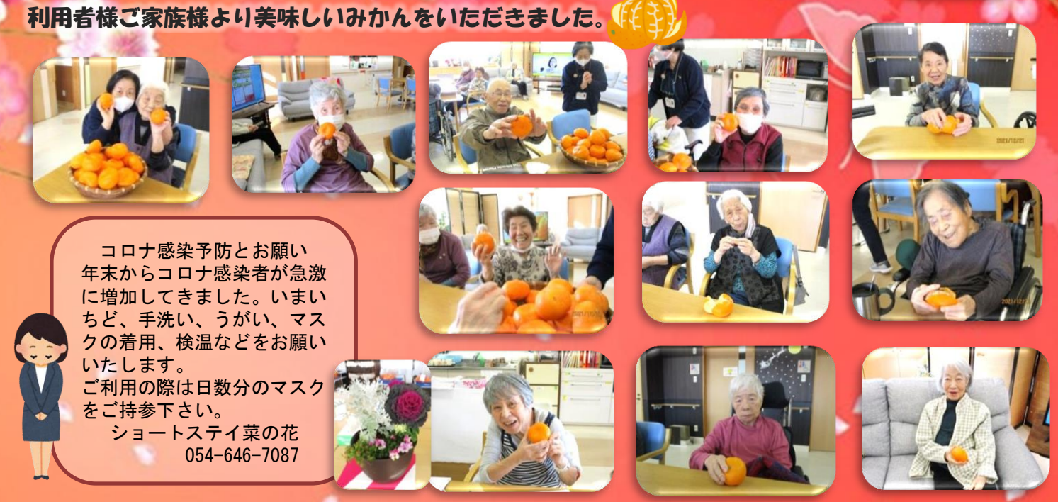
利用者様ご家族様より美味しいみかんをいただきました。

コロナ感染予防とお願い 年末からコロナ感染者が急激に増加してきました。いまいちど、手洗い、うがい、マスクの着用、検温などをお願いいたします。 ご利用の際は日数分のマスクをご持参下さい。 ショートステイ菜の花 054-646-7087