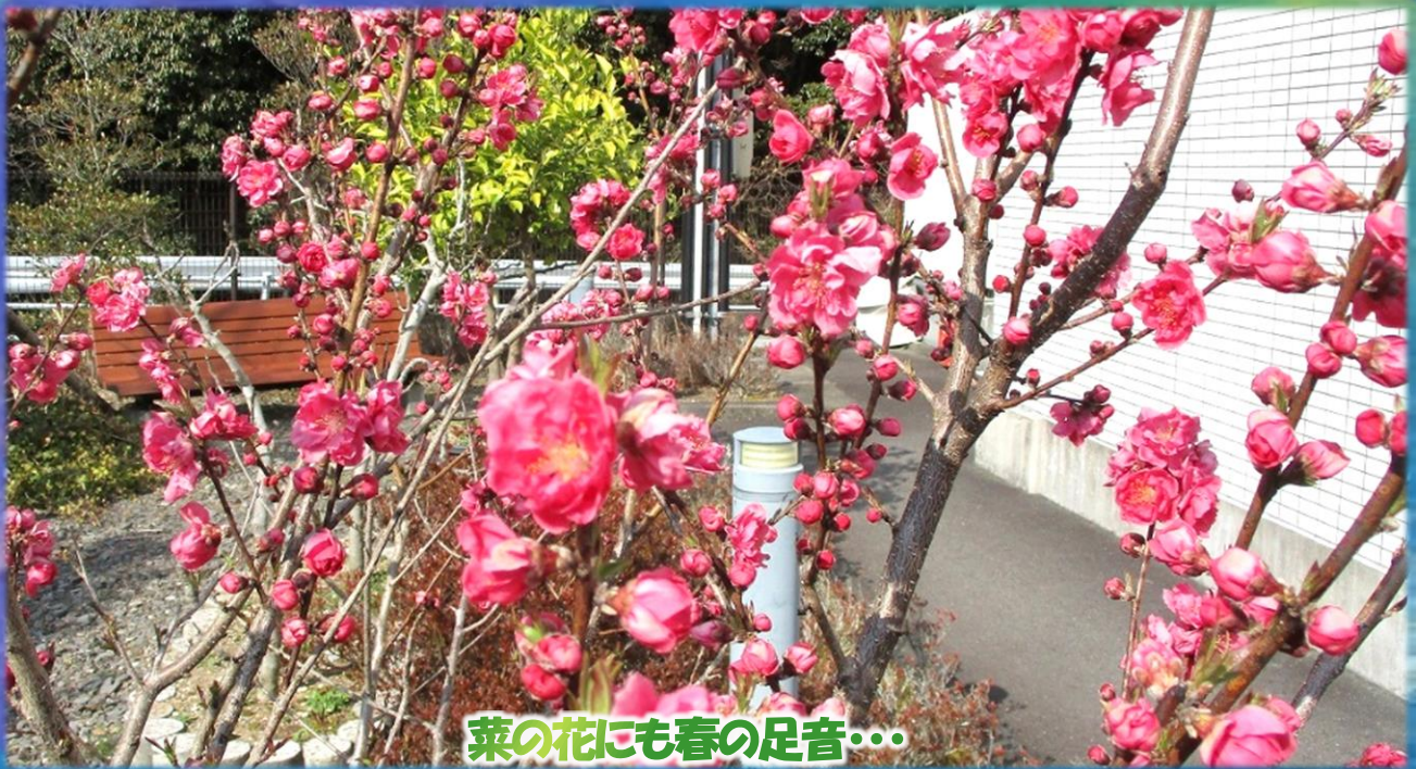
菜の花にも春の足音...