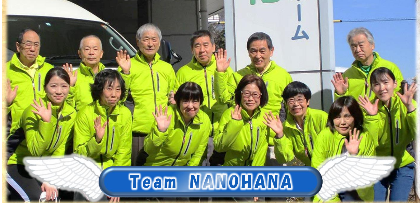
Team NANO HANA