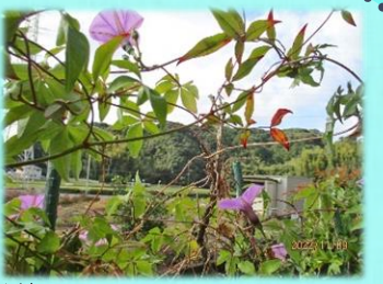
季節外れの朝顔が咲いています

意味くほっとする・心と身体の健康を回復・大宇宙に充滿する命> 11月の Healing は、🌸「メンタルヘルス」🌸です。