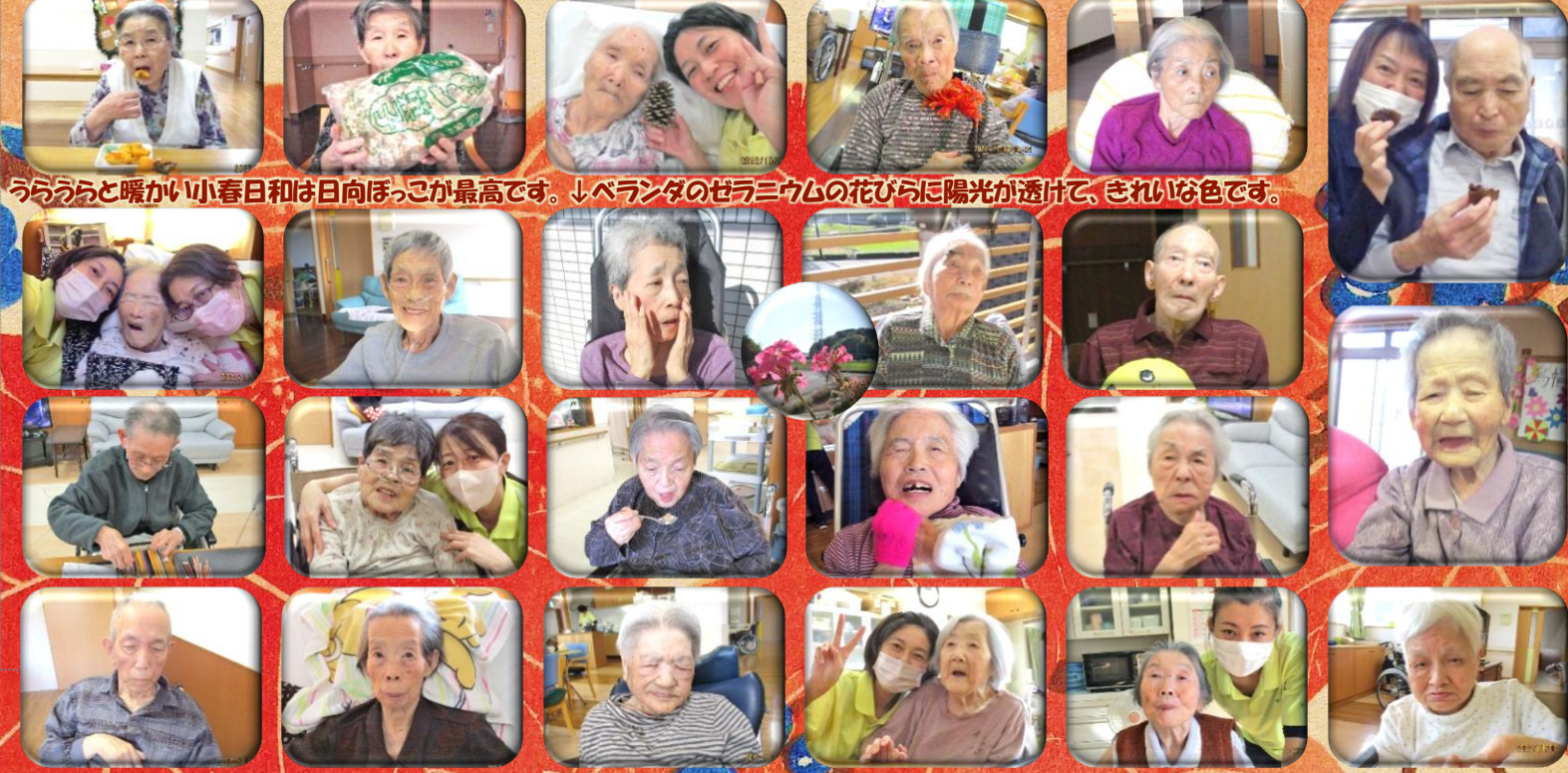
うらうらと暖かい小春日和は日向ぼっこが最高です。↓ベランダのセラニウムの花びらに陽光が透けて、きれいな色です。