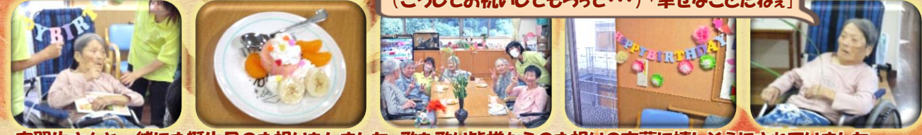
実習生さんと一緒にお誕生日のお祝いをしました。歌を歌い皆様からのお祝いの言葉に嬉しそうにされていました。