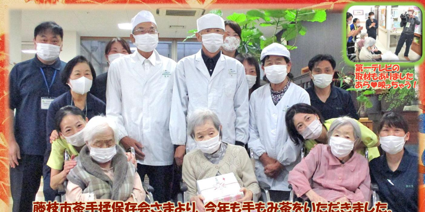
藤枝市茶手揉保存会さまより、今年も手もみ茶をいただきました。 毎年、美味しいお菓子と一緒に大事に楽しませていただいています。今年も貴重な手揉み茶を、ありがとうございました。