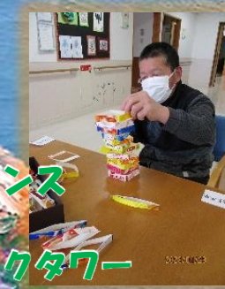
絶妙なバランス パックタワー