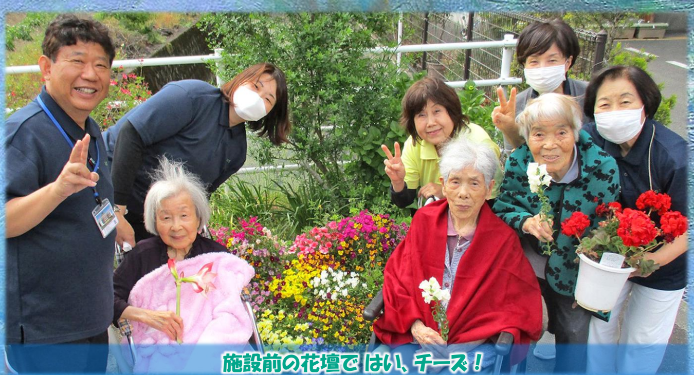
施設前の花壇ではい、チーズ!