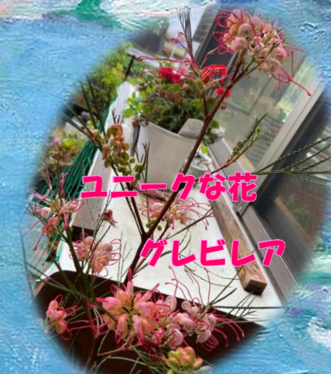
ユニークな花 クレビシア