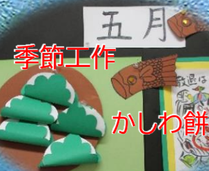
五月 季節工作 かしわ餅