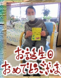
お誕生日 おめでとうございます