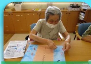
模様の金魚を貼ります