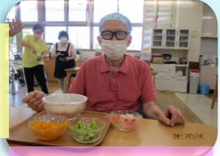
これから飾ります！