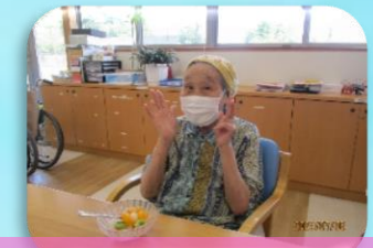
美味しそうに出来たよ！