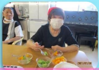
どれを入れようか迷っちゃう