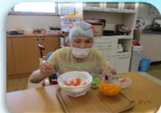
次はどれを飾ろうか…