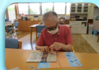
う～ん どこに金魚柄を貼ろうかな