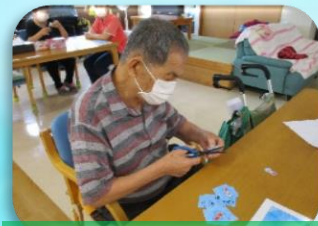
金魚柄を切り出します