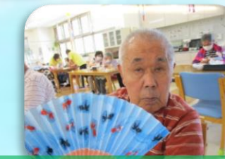
扇子越しに元気ですか？