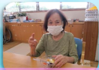
美味しそうに出来たよ