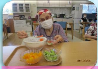
出来上がりが楽しみ♡