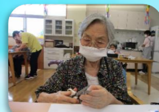
どうかしら？キレイです！