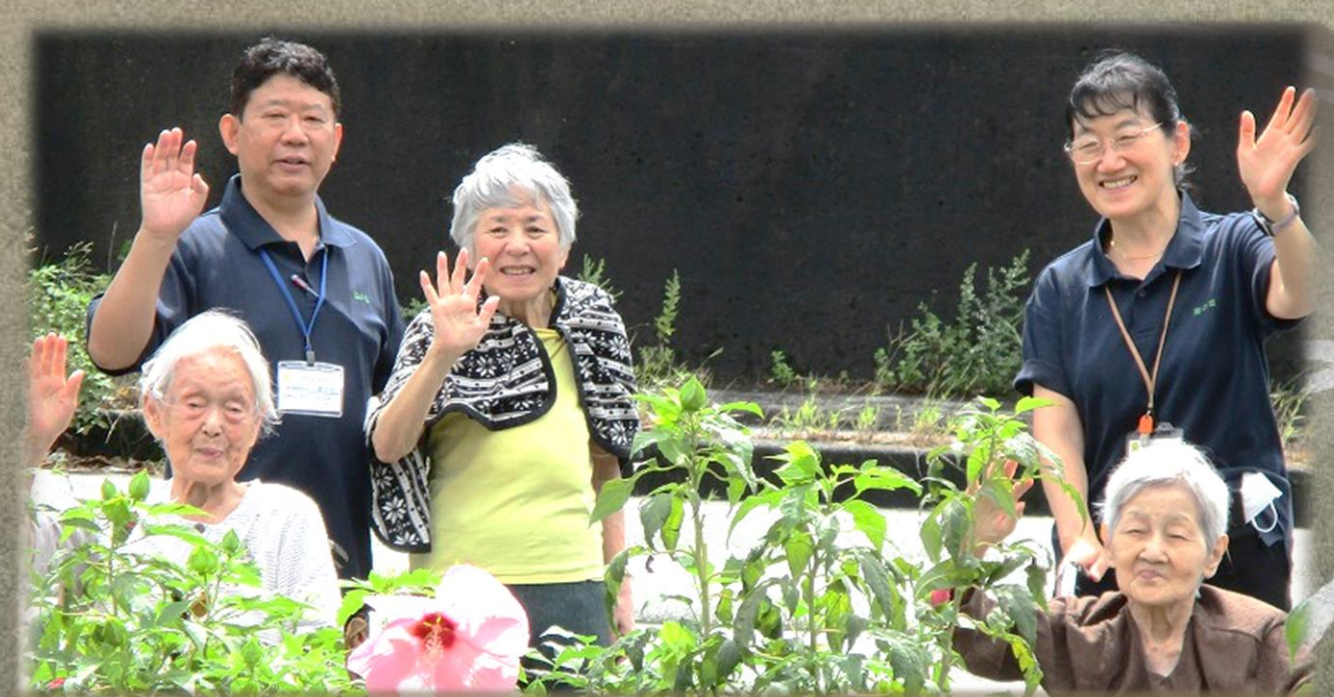
施設前の畑に咲いている大きなお花「タイタンビカス」の前で、はいチーズ！