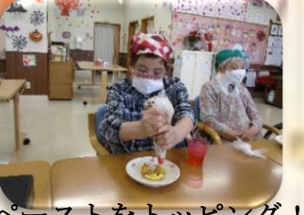
栗ペーストをトッピング！！