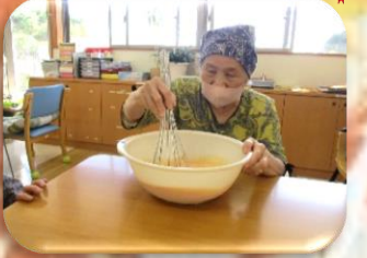
混ぜるの中々大変だな～