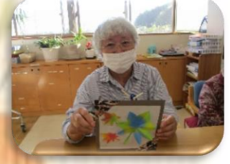
きれいに出来たよ♪