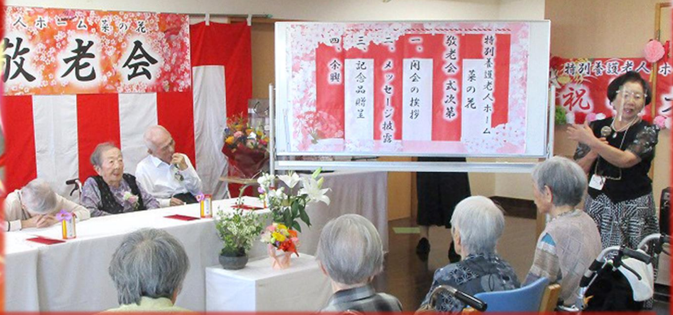
令和5年度 菜の花 敬老会を開催しました

「ショートステイ 菜の花」の最近の様子をご紹介します。利用者様の素敵な笑顔をご覧ください！！