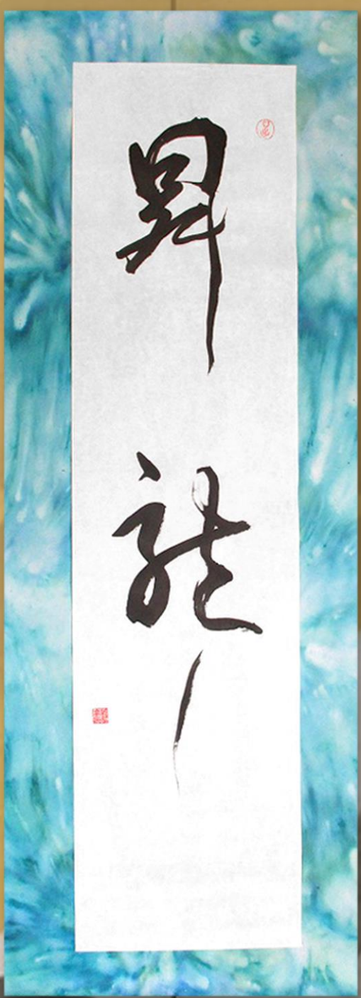
揮毫 書道倶楽部講師 紅林先生