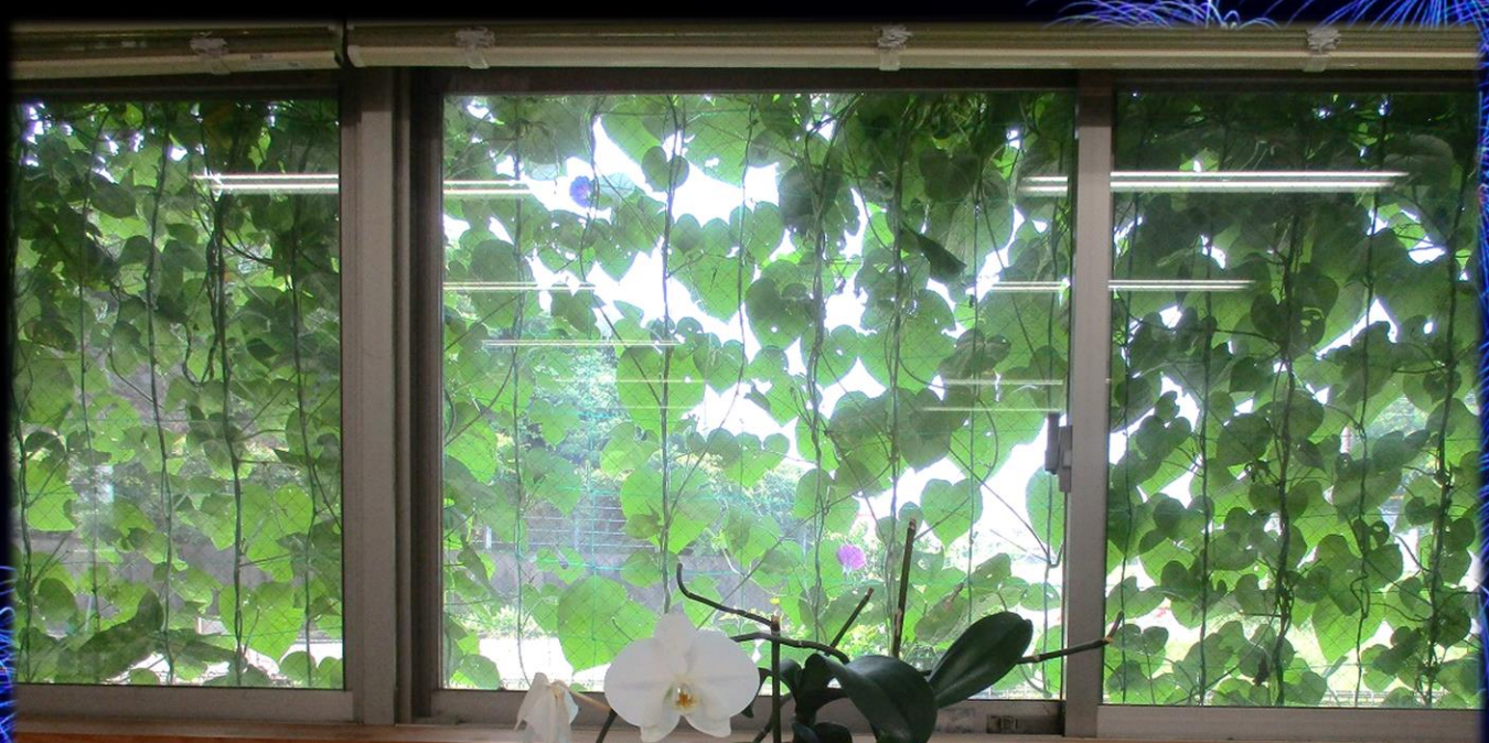
暑い日差しをグリーンカーテンが和らげてくれます。ちうほらと咲く朝顔も涼し気です。