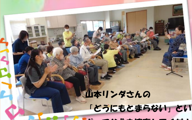
山本リンダさんの「どうにもとまらない」というポップな曲も演奏してくださいました♪