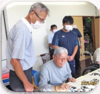
今年の菜の花敬老会は、百一賀祝い一名様、百賀祝い三名様、卒寿祝い四名様、米寿祝い三名様が年祝いを迎えられました。

令和6年8月21日 書道倶楽部 今回の書道倶楽部は、「秋刀魚」、「立秋」といった「秋」に関する言葉や、ご自身の名前といった課題に挑戦していただきました。最初は乗り気ではなくしぶしぶといったご様子の方も、いざ始まってみれば何枚もご自身の名前や「萩」の文字を書いておられました。そのほか、皆様競うように、「立秋」、「野分」といった文字に挑まれていました。今回が初参加の方もいらっしゃいましたが、途中で休憩が必要な程頑張ってくださいました。また来月も皆様で楽しく行って行きたいと思っております。