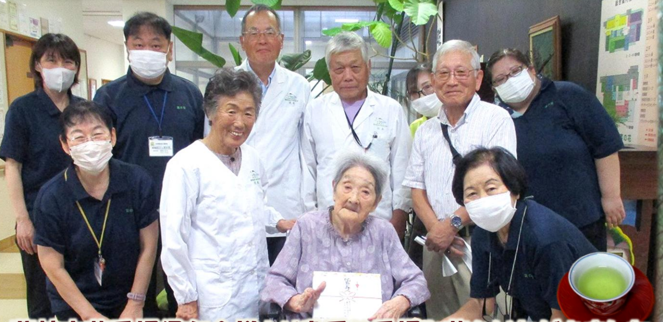
藤枝市茶手揉保存会様より貴重な手揉み茶をいただきました