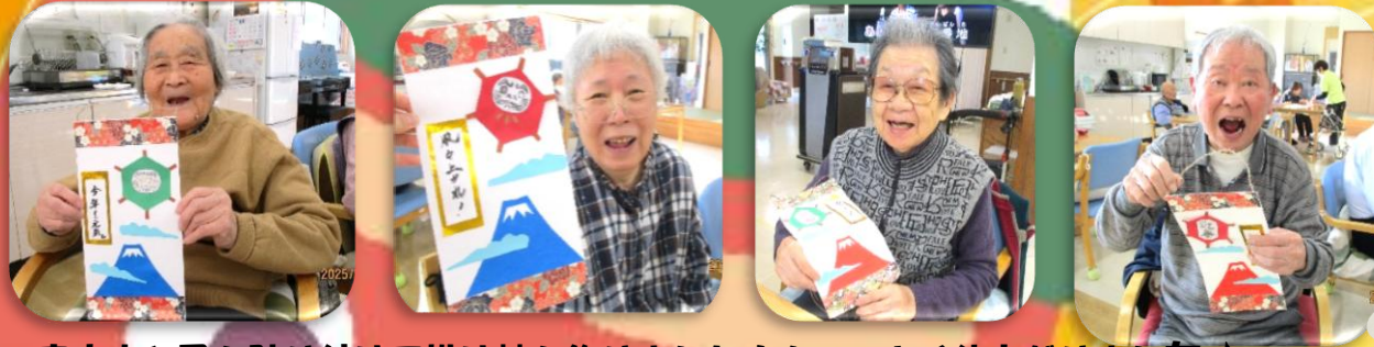
富士山と凧を貼り付けて掛け軸を作りました!カッコよく仕上がりました♪