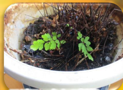
アジアンタムの新芽