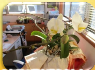
3年目の蘭も咲きました