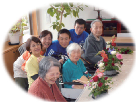
潤い豊かな生活を:華道倶楽部