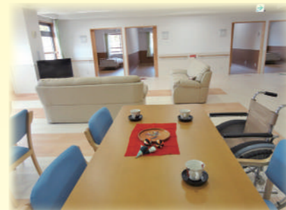
ユニット食堂・リビング