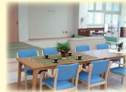
デイサービスセンター