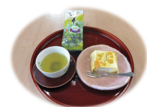
季節の美味を楽しむ:舌鼓倶楽部