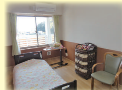
居室レイアウト例