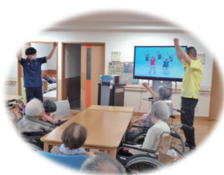
歌って踊って健康アップ:健康倶楽部

この他にも、囲碁倶楽部、書道倶楽部・絵手紙倶楽部など多彩なクラブを展開しています。