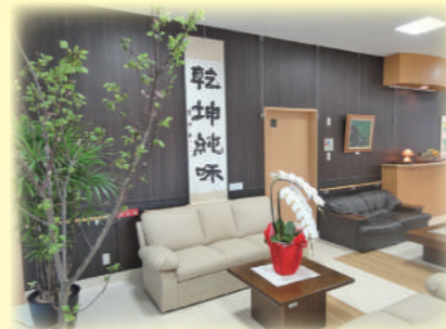
エントランス~ロビー