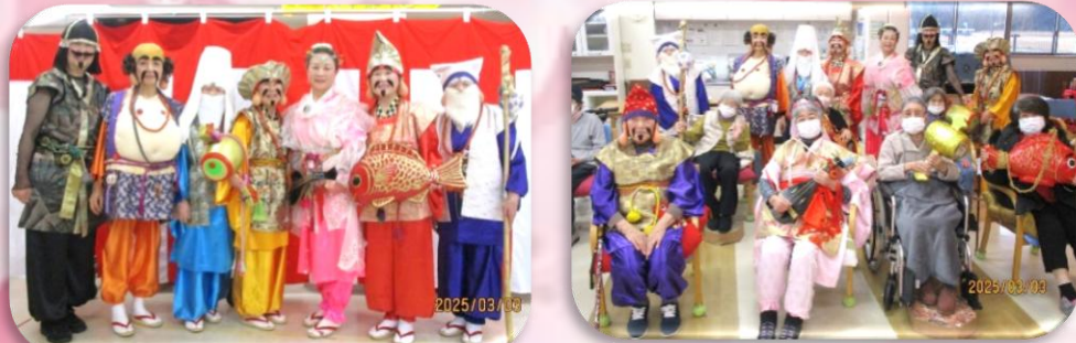
藤枝元祖七福神の方々が見え踊りを披露して下さいました♪