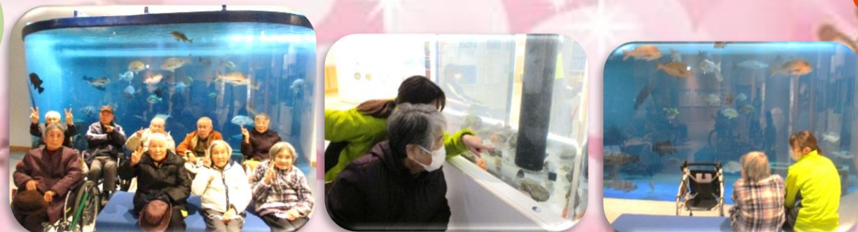
焼津の「うみしる」に外出! 沢山の魚を見ることができました♪