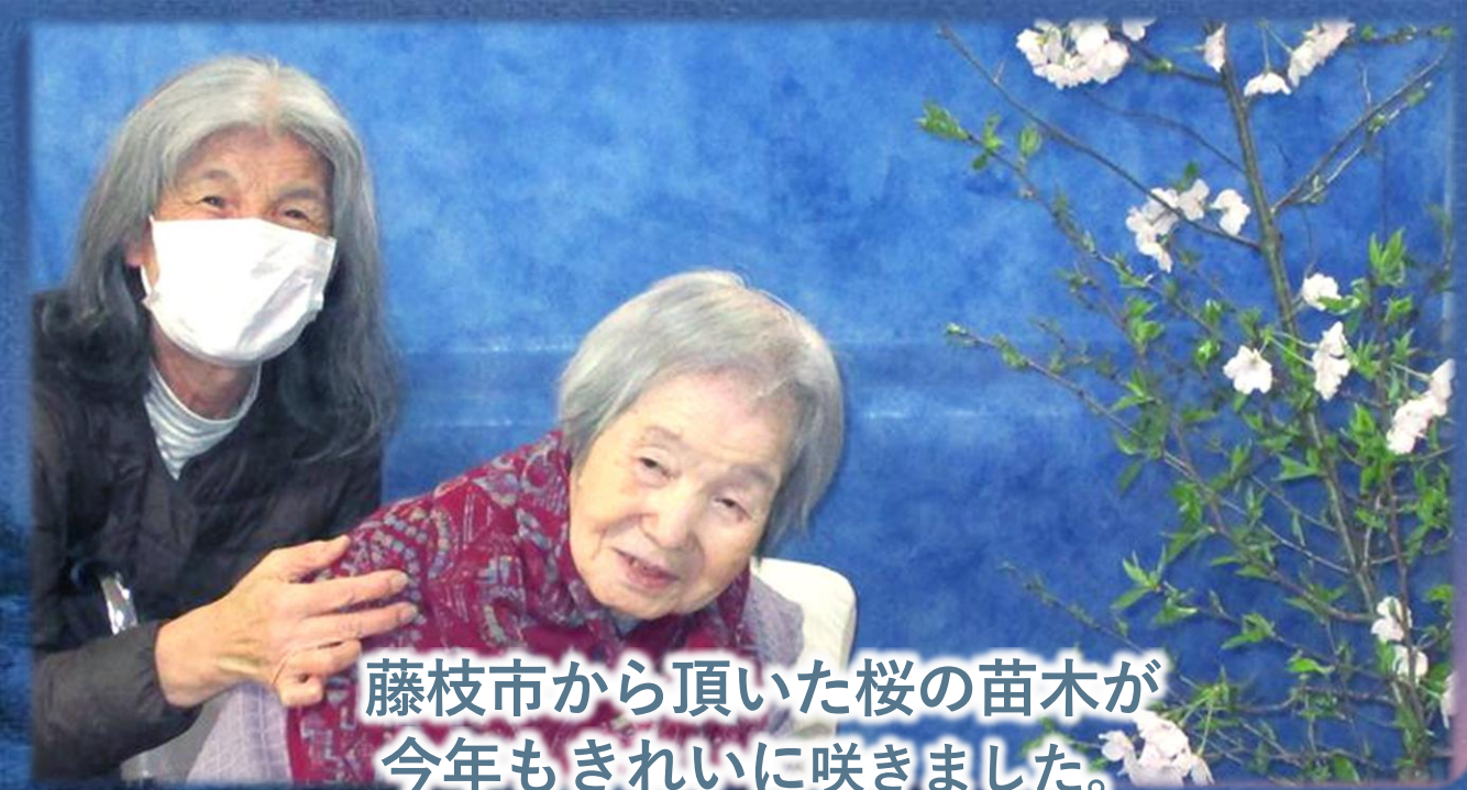
藤枝市から頂いた桜の苗木が今年もきれいに咲きました。