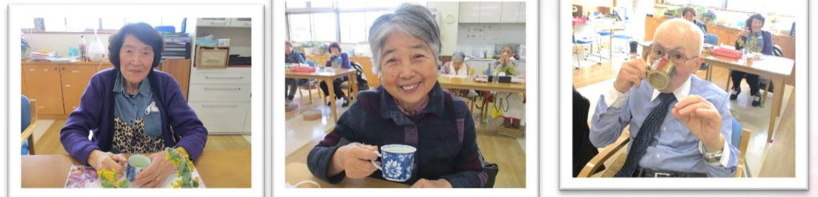
抹茶ラテといちごのロールケーキでティータイム♪