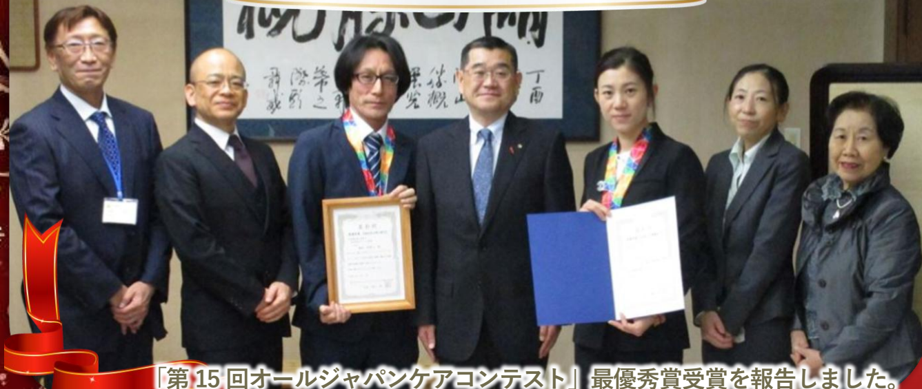
「第15回オールジャパンケアコンテスト」最優秀賞受賞を報告しました。